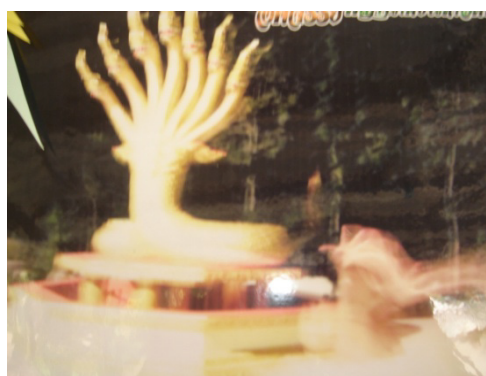
ภาพที่ ๑๔ - ๑๕ ภาพรอยพระพุทธบาทเวินปลา กับภาพที่ช่างภาพถ่ายได้ในพิธีบวงสรวง พญานาคเห็นเป็นเจตสิกของพญานาคกำลังเลื้อยมาที่รูปปั้นพญานาค ที่ทางวัดได้สร้างและอัญเชิญพญานาคให้มาสิงสถิต