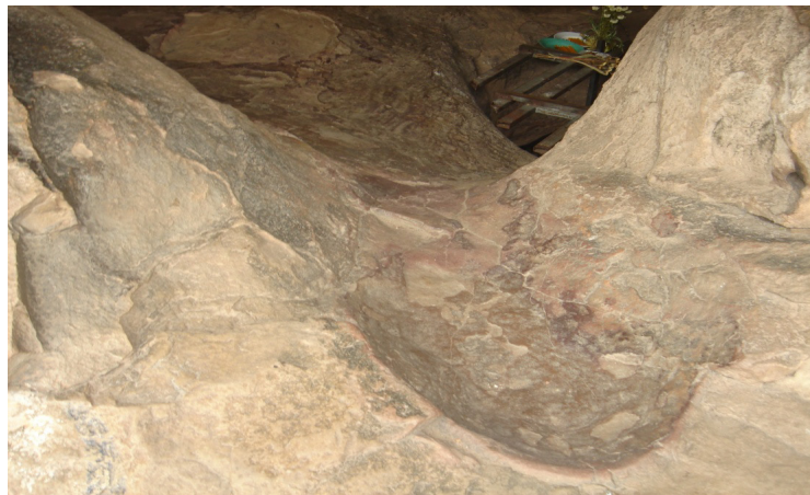
ภาพที่ ๒ - ๕ ภาพรอยพระพุทธรูป บัวบก มีถ้ำและรูปพญานาคอยู่ในใกล้เคียง บริเวณรอยพระพุทธรูป

วันที่ ๒๑ มีนาคม ๒๕๕๖.