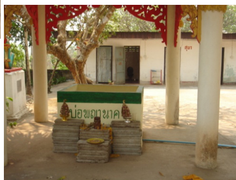
ภาพที่ ๑๐ - ๑๒ รอยพระพุทธรบาทเวินกุ่ม กับบ่อพญานาค ที่เชื่อว่ามิพญานาคขึ้นมาจากแม่น้ำโขง ทางปล่องนี้ ปัจจุบันทางวัดได้ก่ออิฐล้อมรอบ เป็นรูปสี่เหลี่ยมและทำหลังคาครอบไว้ วันที่ ๒๒ มีนาคม ๒๕๕๖.