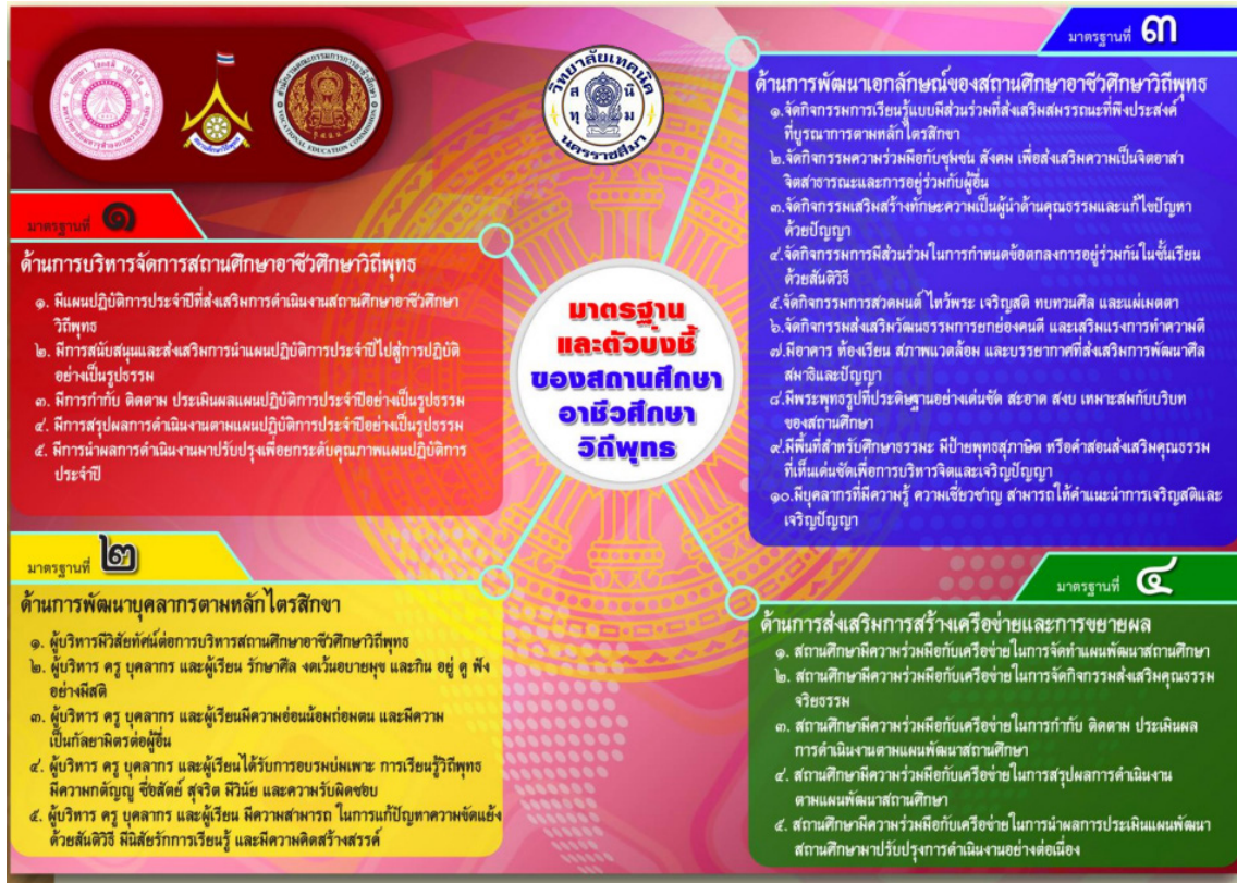
แผนภาพที่ ๒ มาตรฐานและตัวบ่งชี้ของสถานศึกษาอาชีวศึกษาวิถีพุทธ