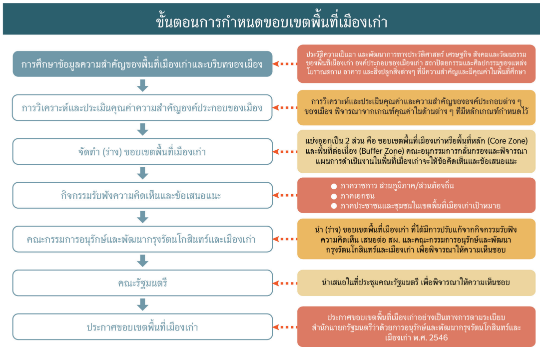
ภาพที่ 1: แผนภาพแสดงขั้นตอนกำหนดขอบเขตพื้นที่เมืองเก่า

ข้อมูลทางประวัติศาสตร์ต่างๆ ร่วมกับการประยุกต์ใช้การสำรวจโดยใช้อากาศยานไร้คนขับ (UAV) เพื่อจัดทำแผนที่จากภาพถ่ายมุมสูงของพื้นที่ศึกษา เมื่อค้นพบองค์ประกอบที่สำคัญของเมืองเก่า จะดำเนินการศึกษาเพื่อจัดทำคำอธิบายและการประเมินคุณค่าความสำคัญ จากนั้นจึงนำมาจัดทำแผนที่เพื่อศึกษาถึงการเกาะกลุ่มและการกระจายตัวของทำเลที่ตั้ง ซึ่งจะนำไปสู่การจัดทำร่างขอบเขตเบื้องต้นเพื่อนำไปสู่การจัดประชุมรับฟังความคิดเห็นจากผู้มีส่วนร่วมทุกภาคส่วนเพื่อร่วมตัดสินใจร่างขอบเขตที่คณะผู้ศึกษาได้นำเสนอในการรับฟังความคิดเห็น หลังจากนั้นจึงนำผลลัพธ์ของการรับฟังความคิดเห็นมาปรับปรุงจนได้ขอบเขตที่เหมาะสม และจัดทำระบบสารสนเทศทางภูมิศาสตร์โดยใช้ฐานข้อมูลสารสนเทศทางภูมิศาสตร์ของกรมโยธาธิการและผังเมืองเป็นข้อมูลพื้นฐาน เพื่อนำไปสู่การกำหนดขอบเขตพื้นที่เมืองเก่า และนำผลการศึกษาเสนอเพื่อขอรับการพิจารณาจากที่ประชุมคณะอนุกรรมการกลั่นกรอง และพิจารณาแผนการดำเนินงานในพื้นที่เมืองเก่า และคณะกรรมการอนุรักษ์และพัฒนากรุงรัตนโกสินทร์และเมืองเก่าเพื่อพิจารณาและเสนอต่อคณะรัฐมนตรีเพื่อดำเนินประกาศขอบเขตพื้นที่เมืองเก่าจะเชิงเทราต่อไป