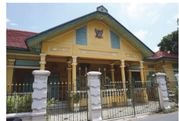
(20) อาคารพุทธสมาคมฉะเชิงเทรา (ศาลมณฑลปราจีน)