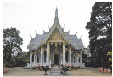
(14) ศาลหลักเมืองฉะเชิงเทรา