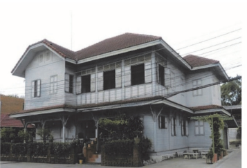
(9) วัดเทพนิมิตร