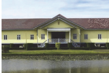
(22) อาคารไม้สัก 100 ปี กองบัญชาทหารบก มณฑลปราจีน