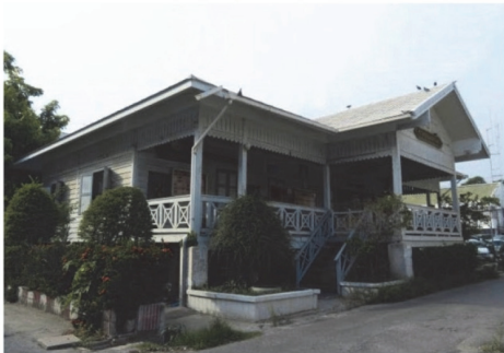
(23) อาคารสถานีตำรวจภูธรเมืองฉะเชิงเทรา