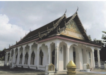
(10) วัดพยุภคอินทาราม (วัดเจดีย์)