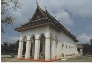
(11) วัดสายชล ณ รังสี