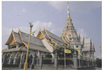
(5) วัดโสธรวรารามวรวิหาร