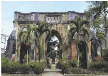
(13) วัดเซนต์ปอล