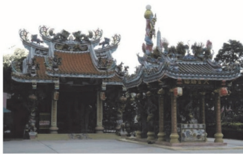
(15) ศาลเจ้าพ่อหลักเมืองจังหวัดฉะเชิงเทรา