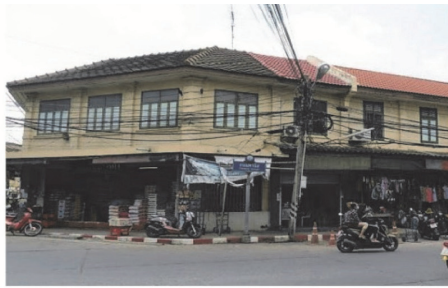
(26) ย่านการค้าตลาดทรัพย์สินพระมหากษัตริย์ จังหวัดฉะเชิงเทรา