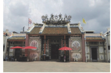
(12) วัดจีนประชาสโมสร (วัดเล่งฮกยี่)