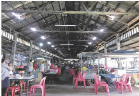
(27) กลุ่มย่านการค้าบริเวณปากคลองท่าไข่