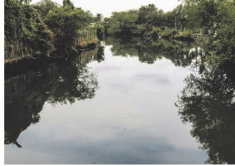
(2) คลองท่าไข่ และประตูน้ำท่าไข่