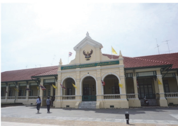
(19) อาคารสำนักงานทรัพย์สินพระมหากษัตริย์ จังหวัดฉะเชิงเทรา (ศาลาว่าการมณฑลปราจีน)