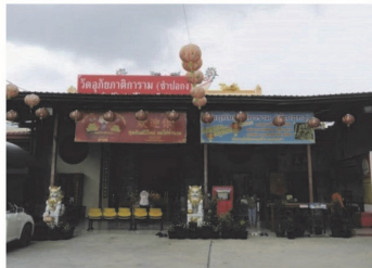
(8) วัดอุภัยภาติการาม (วัดชำปอกง)