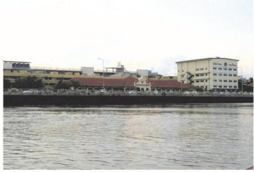
(1) แม่น้ำบางปะกง