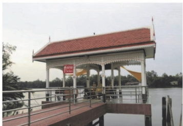
(7) วัดภิกขุสังขรณ์ (วัดแหลมใต้)