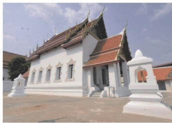
(6) วัดปิตุลาธิราชรังสฤษฎ์ (วัดเมือง)