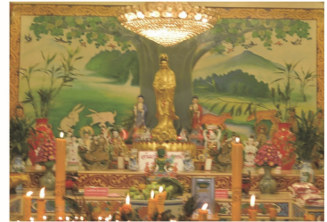
(16) ศาลเจ้าแม่กวนอิมลอยน้ำ