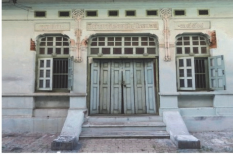
(21) อาคารไปรษณีย์หลังเก่า