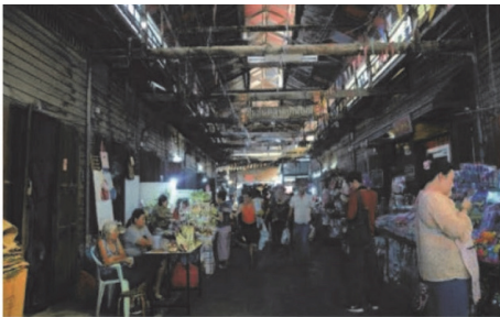
(25) ย่านตลาดบ้านใหม่