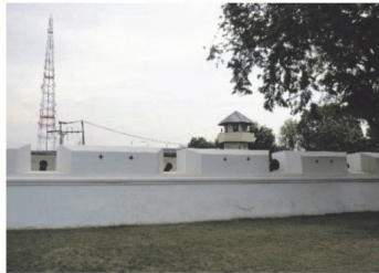
(4) ป้อมและกำแพงเมืองฉะเชิงเทรา