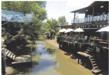
(3) คลองกลาง