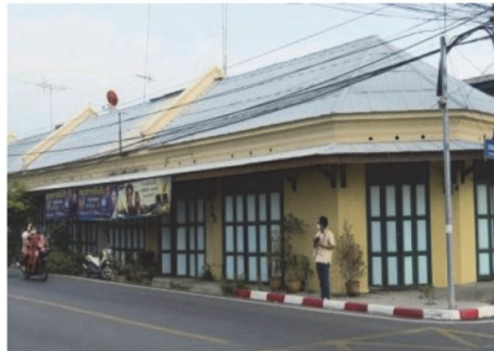
(24) ชุมชนหน้าเมือง หรือตลาดหน้าเมือง