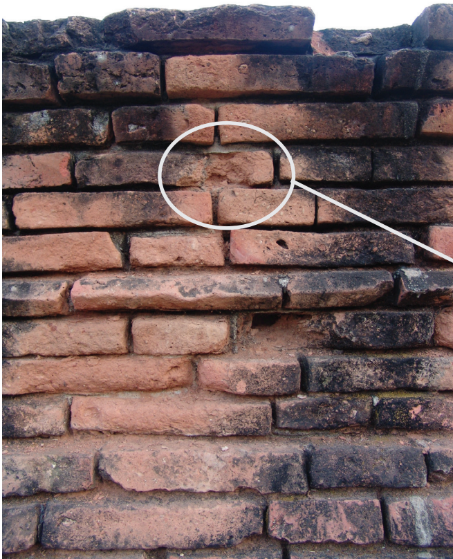
รูปที่ 11 (ซ้าย)

จากตัวอย่างข้างต้นคงพอจะแสดงให้เห็นถึงผลกระทบที่เกิดจากเกลือบนกำแพงหรือฐานของโบราณสถานอิฐได้บ้าง แต่ในความเป็นจริงแล้วไม่เพียงแต่โบราณสถานอิฐเท่านั้นที่เสื่อมสภาพเพราะเกลือ อิฐที่ใช้ก่อสร้างอาคารในยุคปัจจุบันก็สามารถเสื่อมสภาพเพราะเกลือได้ โดยเฉพาะถ้าอิฐนั้นเปื่อยและสัมผัสกับสภาพแวดล้อมโดยตรง (ซึ่งอาจเป็นเพราะไม่ได้มีการฉาบปูนบนกำแพงนั้น หรือปูนที่ฉาบหลุดร่อนไปตามกาลเวลาและจากการเสื่อมสภาพ) ดังตัวอย่างในรูปที่ 13 ซึ่งเป็นภาพผนังด้านหลังของอาคารพาณิชย์อายุประมาณ 30 ปีห้องหนึ่งในเขตราชบุรีบูรณะ กรุงเทพมหานคร จะเห็นว่ามียุทธะบาย