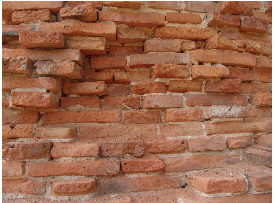
รูปที่ 4 (บน)

จากรูปที่ 2 จะเห็นว่าเนื้ออิฐบางส่วนบริเวณฐานของเจดีย์ได้ถูกเกลือทำให้บวมและแตกออกโดยเฉพาะบริเวณขอบอิฐ และสาเหตุที่บริเวณส่วนบนที่เป็นการเปลี่ยนระดับของฐานเจดีย์ถูกทำลายไปมากกว่าส่วนล่างของฐาน ก็อาจสันนิษฐานได้ว่าเป็นเพราะบริเวณนี้เป็นบริเวณที่รับน้ำมากกว่ากล่าวคือน้ำในอิฐนอกจากจะถูกดูดขึ้นมาจากน้ำใต้ดินหรือน้ำที่ท่วมแล้ว ยังมีน้ำฝนที่อาจขังอยู่บนฐานและซึมเข้าสู่เนื้ออิฐโดยกระบวนการคาปิลารี่ร่วมด้วย (คาปิลารี่แอกชันไม่จำเป็นต้องเกิดขึ้นตรงข้ามกับแรงโน้มถ่วงของโลกเท่านั้น แต่สามารถเกิดขึ้นได้ทุกทิศทาง ซึ่งในที่นี้ก็คือการดูดจากพื้นด้านบนของฐานเข้าสู่ตัวฐาน) จึงทำให้บริเวณนี้เป็นบริเวณที่ชื้นและเกิดการเปื่อยและแห้งมากกว่าส่วนอื่น