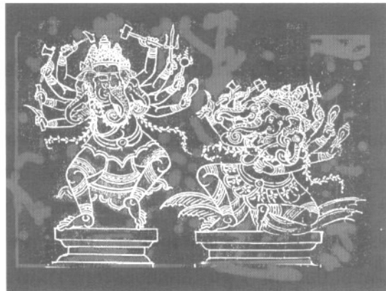
พระคเนศยืน พระคเนศนั่ง