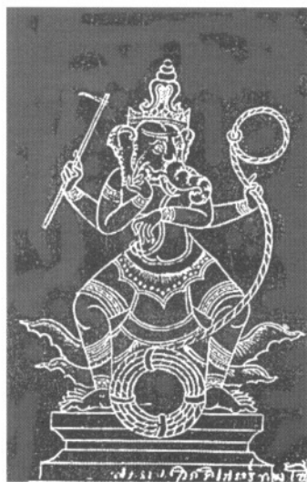
พระคเณศทรงเข็อกบาท