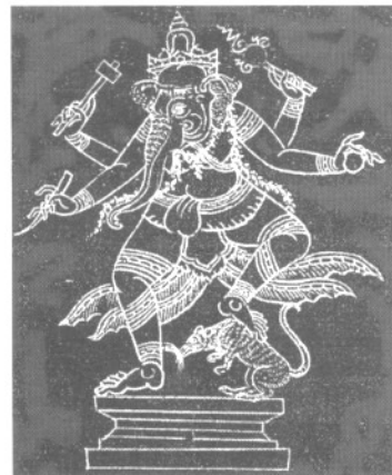
พระคเนศจำสถาน