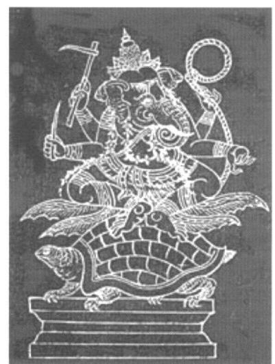
พระคเณศไปเกษียรสมุทร