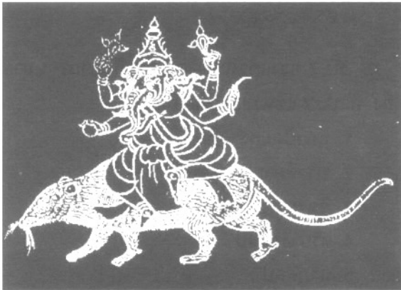
พระคเนศทรงหนุ