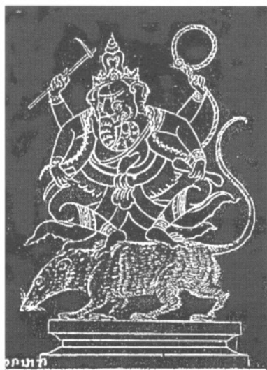
พระคเณศทรงหนุไปปราบอสุรกังคี