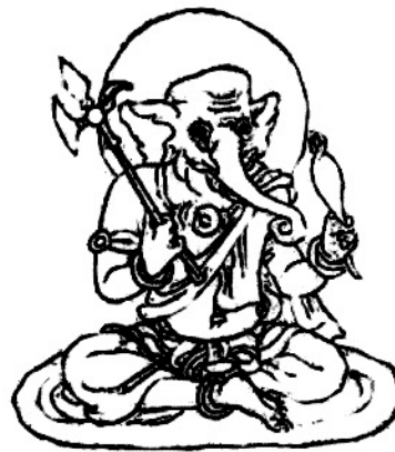
พระคเนศจีน มือหนึ่งถือหัวผักกาด