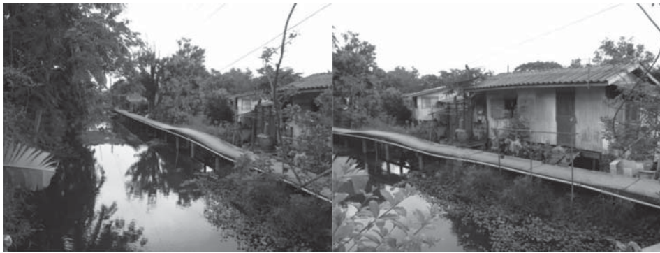
ชุมชนชานเมือง (ชุมชนลำพุทธา)