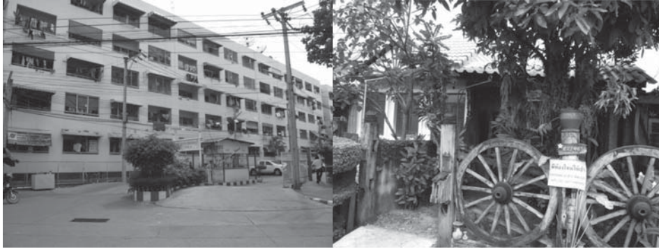
เคหะชุมชน (เคหะชุมชนธนบุรี)