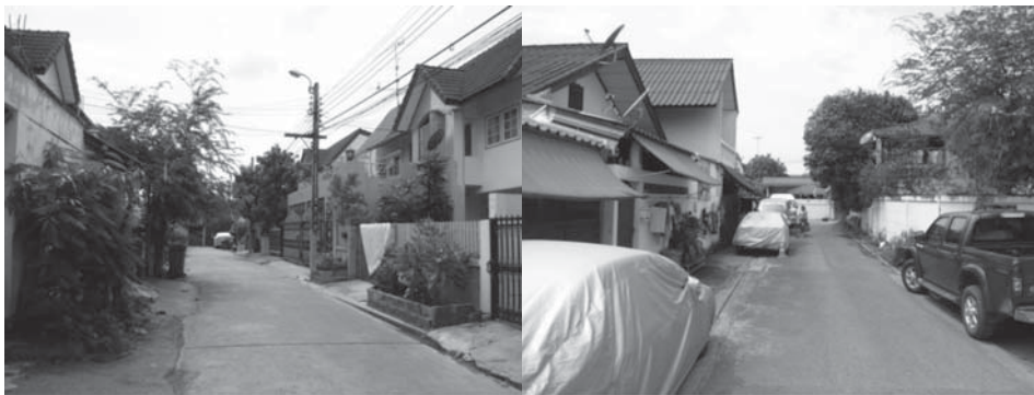
ชุมชนหมู่บ้านจัดสรร (ชุมชนหมู่บ้านสมนึก)

ภาพที่ 2: ลักษณะทางกายภาพของเคหะชุมชน ชุมชนชานเมือง และชุมชนหมู่บ้านจัดสรรบริเวณชานเมือง