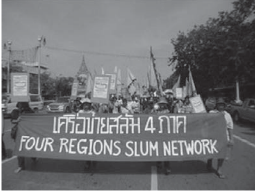
ภาพที่ 3: การรวมกลุ่มของชาวชุมชนแออัดเพื่อการเจรจาต่อรองในระดับการจัดการพื้นที่ในเมืองและระดับนโยบายต่อการแก้ปัญหาด้านสิทธิการอยู่อาศัยของชุมชนแออัดกับภาครัฐและเจ้าของกรรมสิทธิ์ที่ดิน