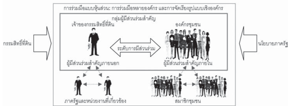
ภาพที่ 6: กรอบแนวคิดระดับองค์กรฟื้นฟูเมืองในกระบวนการวางแผนฟื้นฟูเมือง ที่มา: ปรับปรุงจาก Hamdi, and Goethert, 1997: pp. 67-68

การวางแผนฟื้นฟูเมืองร่วมกันได้อย่างเหมาะสม แต่จะมีลักษณะในรายละเอียดเป็นอย่างไร ยังต้องรอการท้าทายแนวคิดของเหล่านักวิจัยมาร่วมกันนำเสนอรูปแบบองค์กรฟื้นฟูเมืองที่เหมาะสมแต่ละลักษณะเฉพาะของพื้นที่ เพื่อการอธิบายรูปแบบลักษณะขององค์กรฟื้นฟูเมืองที่เหมาะสมในบริบทต่างๆ ของประเทศไทย ทั้งนี้เพื่อการแก้ไขปัญหาวิกฤตเหตุการณ์ต่างๆ ที่กล่าวมาข้างต้น