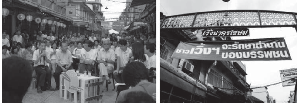
ภาพที่ 5: การตื่นตัวของชุมชนเวียงนครเขมมในการพยายามมีส่วนร่วมในกระบวนการวางแผนฟื้นฟูเมืองในที่ดินเช่าอยู่อาศัยมากกว่า 3 ชั่วโมงคน