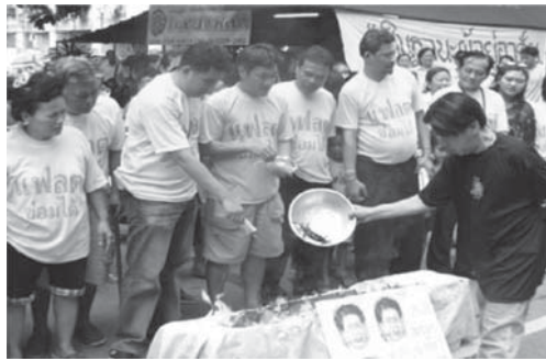
ภาพที่ 4 ความขัดแย้งในดำเนินการฟื้นฟูเมืองกรณีพื้นที่ย่านแพลตตินแดง ซึ่งขาดการมีส่วนร่วมของประชาชนในพื้นที่ของกระบวนการวางแผน ที่มา: หนังสือพิมพ์สวัสดีกรุงเทพฯ (2550: ออนไลน์)

ชุมชนเวียงนาครเขมมมีแนวโน้มของการฟื้นฟูเมืองที่คล้ายกับชุมชนแพลตตินแดง แต่ต่างกันตรงเจ้าของกรรมสิทธิ์ที่ดินเป็นภาคเอกชนที่อยู่ภายใต้การดูแลของสำนักงานบริพัตรกำลังจะสิ้นสุดสัญญาเช่าที่ดินในเดือนกันยายน ปีพ.ศ.2555 ทั้งนี้ชุมชนเวียงนาครเขมมเป็นย่านการค้าเก่าแก่แห่งหนึ่งของเกาะรัตนโกสินทร์ตั้งถิ่นฐานอยู่บนการเช่าที่ดินเนื้อที่ 14 ไร่ 1 งาน 91 ตารางวา ทั้งนี้ทางเจ้าของกรรมสิทธิ์ที่ดินมีแนวโน้มไม่ต่อสัญญาเช่า และมีโครงการฟื้นฟูพื้นที่ดังกล่าวโดยร่วมลงทุนกับภาครัฐกิจเอกชน (private-investor partnership) จากสถานการณ์ที่เกิดขึ้นส่งผลทำให้ชาวชุมชนเวียงนาครเขมมได้รวมกลุ่มออกมาเคลื่อนไหวคัดค้าน นอกจากนี้ยังรวมกลุ่มจัดตั้งเป็นบริษัทนิติบุคคลรวมเงินของชาวชุมชนเพื่อเจรจาขอซื้อที่ดินให้เป็นกรรมสิทธิ์ของชุมชน แม้ว่าบริษัทนิติบุคคลของชุมชนเวียงนาครเขมมจะเสนอราคาซื้อที่ดินที่ให้ราคาสูงกว่าราคากลางที่ประเมินไว้แล้วก็ตาม แต่การเจรจานี้ได้ถูกปฏิเสธในเวลาต่อมา (มติชน, 2554: ออนไลน์)