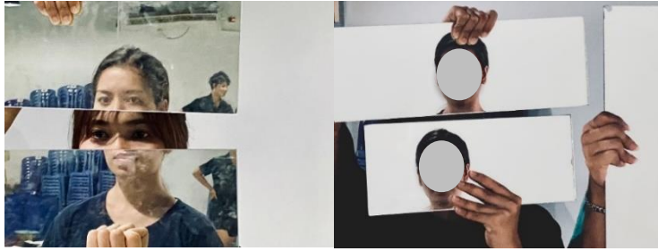
ภาพ 4 การทดลองใช้กระจกเงาในการทดลองออกแบบการแสดง