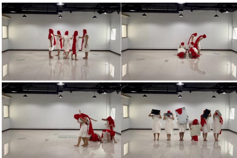
ภาพ 7 บรรยายการแสดง

จากการออกแบบทั้ง 8 องค์ประกอบผู้วิจัยได้นำมาผสมผสานรูปแบบการแสดงและจัดทำเป็นวิดิทัศน์ดังภาพ 7 นำเสนอต่อผู้ทรงคุณวุฒิประเมินคุณภาพจำนวน 3 คน