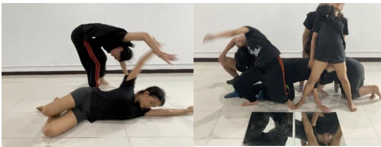
ภาพ 3 การฝึกซ้อมเพื่อให้การแสดงมีพลวัต

ที่มา : ถ่ายภาพเมื่อวันที่ 23 กรกฎาคม 2564 ห้องสุริยะ 2 มหาวิทยาลัยราชภัฏบ้านสมเด็จเจ้าพระยา กรุงเทพมหานคร