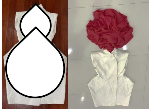
ภาพ 6 เครื่องแต่งกายสีขาวและสีแดง

ผู้วิจัยได้คำนึงถึงข้อมูลที่ได้ศึกษาจากงานวิจัยสร้างสรรค์นาฏยศิลป์ที่ความเกี่ยวข้องกับหลักธรรมทางพระพุทธศาสนา ซึ่งผู้วิจัยได้เลือกการใช้สีและการออกแบบโครงร่างชุดการแสดงเข้ามาเป็นสัญลักษณ์ที่จะทำให้คนดูเกิดความระลึกถึงพระพุทธศาสนา แสดงดังภาพ 6