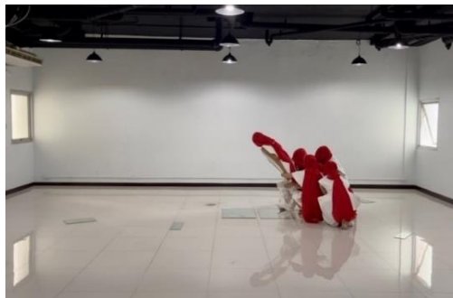
ภาพ 5 สถานที่ในการทดลองออกแบบการแสดง

เนื่องจากสถานการณ์โรคระบาดโควิด-19 ที่แพร่ระบาดอย่างหนักในปัจจุบัน รัฐบาลได้มีขอความร่วมมือให้ไม่มีการรวมตัวของผู้คน ดังนั้น ในการสร้างสรรค์นาฏศิลป์ร่วมสมัยในครั้งนี้ ผู้วิจัยเลือกใช้ห้องสุริยะ 2 อาคาร 1 ชั้น 3 มหาวิทยาลัยราชภัฏบ้านสมเด็จเจ้าพระยา แสดงดังภาพ 5 เป็นสถานที่ในการจัดแสดง