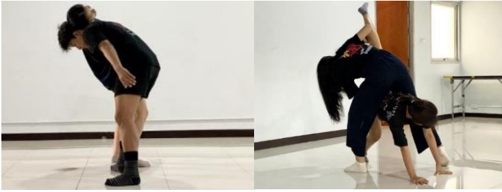
ภาพ 2 การทดลองออกแบบลีลานาฏศิลป์โดยใช้เทคนิคการดันสัดที่เกิดมาจากการสัมผัสระหว่างร่างกาย (Contact improvisation)

ที่มา : ถ่ายภาพเมื่อวันที่ 23 กรกฎาคม 2564 ห้องสุริยะ 2 มหาวิทยาลัยราชภัฏบ้านสมเด็จเจ้าพระยา กรุงเทพมหานคร