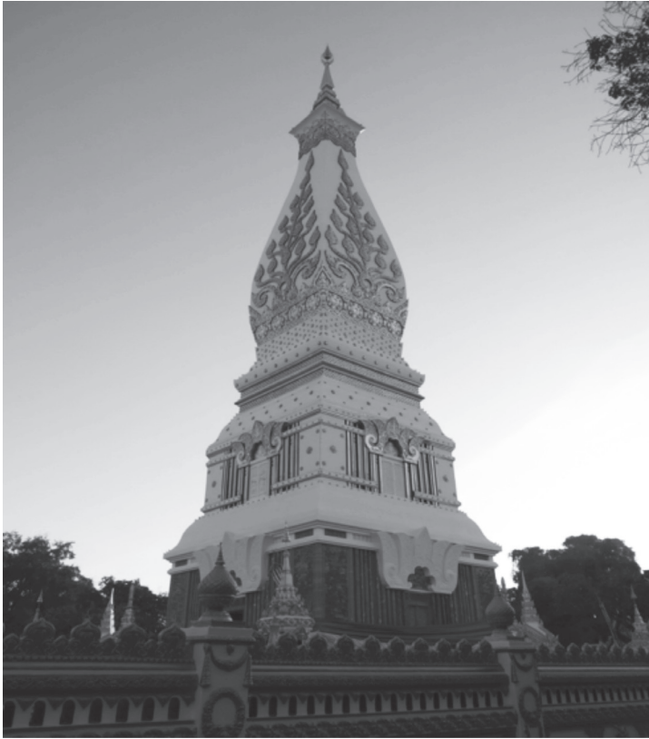
ภาพที่ ๑ พระธาตุพนมองค์ปัจจุบัน

ข้าโอกาส คือกลุ่มคนที่กษัตริย์ล้านช้างได้อุทิศให้เป็นสมบัติของวัดเพื่อ ปรนนิบัติรับใช้พระภิกษุและคอยดูแลพระธาตุพนม ในสมัยก่อนบรรพบุรุษของคนกลุ่มนี้ มีบทบาทมาก กล่าวคือ นอกจากจะเป็นแรงงานของวัดที่มีหน้าที่ทำนา ทำไร่ในที่ดิน ที่เป็นสมบัติของวัดที่เรียกว่า “นาจังหัน” และนำผลผลิตที่ได้มาบำรุงพระภิกษุสงฆ์ ที่อยู่ภายในวัด เพื่อให้พระภิกษุเหล่านั้นได้ปฏิบัติภารกิจให้สำเร็จลุล่วงไปด้วยดี กลุ่ม คนเหล่านี้จึงเป็นกรรมสิทธิ์ของวัดพระธาตุพนมชั่วลูกชั่วหลาน และยังทำหน้าที่ บริหารจัดการวัดพระธาตุพนมโดยอิงอยู่กับความเชื่อว่าพระธาตุพนมเป็นสิ่งศักดิ์สิทธิ์ คู่บ้านคู่เมืองใครคิดลบหลู่จะต้องมีอันเป็นไป นอกจากนี้บ้างตระกูลตั้งตนเป็น