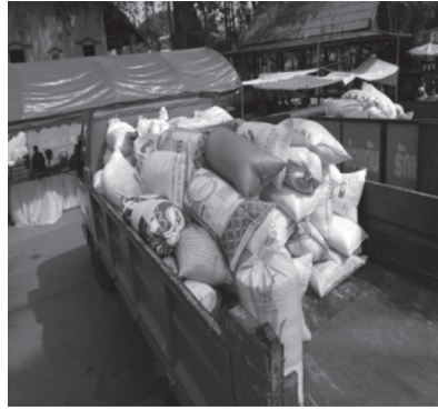
ภาพที่ ๙ ข้าวสารสัญลักษณ์ข้าวโอกาสในพิธีถวายข้าวพิษภาคแด่องค์พระธาตุพนม

๓. พิษสวนและพิษไร่ : องค์ประกอบของความเป็นข้าวโอกาสวัดพระธาตุพนม นอกจากข้าวแล้วสิ่งของที่กลุ่มข้าวโอกาสนำมาถวายแด่พระธาตุพนมคือ ผลผลิตที่ได้จากเรือกสวนไร่นา เพราะคำว่า “ข้าวพิษภาค” มาจากคำว่า พิษ หมายถึง ถึง พิษ และคำว่า ภาค หมายถึง ถึง ส่วน รวมแล้วหมายถึง ส่วนของพิษพันธุ์ ๔ ซึ่งได้แก่ ข้าวโพด มันแกว พริก ต้นหอม มะพร้าว กัลฉวย อ้อย ซึ่งเป็นผลผลิตจากสวน และ ไร่ของกลุ่มข้าวโอกาส สิ่งของเหล่านี้จะนำมาถวายพระธาตุพนมพร้อมกันกับข้าวสาร แต่ผลผลิตเหล่านี้อาจจะเปลี่ยนไปตามฤดูกาล และความจำเป็นของกลุ่มข้าวโอกาส ที่จะต้องปลูกเพื่อนำมาบริโภคและไปจำหน่าย สิ่งของเหล่านี้ถือได้ว่าเป็นบริวารที่ขาดไม่ได้ เพราะกลุ่มข้าวโอกาสยังสำนึกอยู่เสมอว่า ตนเองเป็นบริวารของพระธาตุ ยังใช้ที่ดินของวัด คือ “นาจังหัน” อันเป็นที่ดินซึ่งเป็นสมบัติของวัดพระธาตุพนมใช้ ทำมาหากินเลี้ยงชีพอยู่ตลอดมา