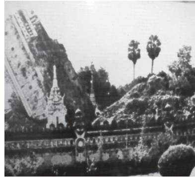
ภาพที่ ๓ องค์พระธาตุพนมก่อนที่จะพังลงมา