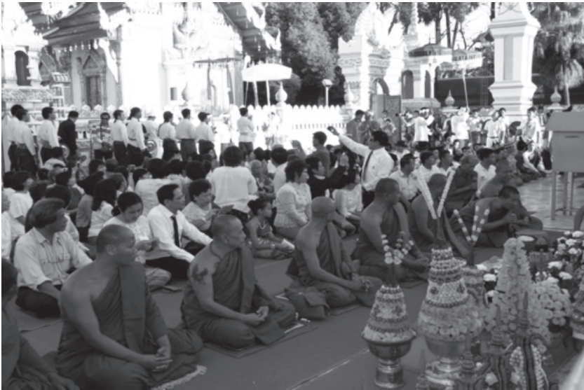
ภาพที่ ๑๓ พิธีถวายสักการบูชาของข้าโอกาสพระธาตุพนมในงานนมัสการพระธาตุพนมประจำปี พ.ศ.๒๕๕๖

พระธาตุพนม ศาสนสถานศักดิ์สิทธิ์คู่บ้านเมืองของชาวอีสาน และเป็นที่เคารพของคนสองฝั่งแม่น้ำโขง มีตำนานเล่าขานกันมาอย่างยาวนานเรียกว่า “อุรังคธาตุตำนานพระธาตุพนม” ที่กล่าวถึงการสร้างพระธาตุพนม และการอุทิศตนเพื่อให้เฝ้ารักษาพระธาตุพนม ซึ่งเรียกว่า “ข้าโอกาส” การอุทิศข้าทาสบริวารเพื่อให้เป็นข้าโอกาสรักษาวัดเป็นที่นิยมทำในหมู่กษัตริย์หรือชนชั้นปกครองตามแถบชายฝั่งแม่น้ำโขง โดยผู้อุทิศข้าโอกาสมีความเชื่อว่าจะได้อานิสงส์อันยิ่งใหญ่ ข้าโอกาสที่ดูแลพระธาตุนั้นจะขาดจากสิทธิ์และการดูแลของทางการ แต่จะอยู่เป็นทาสรับใช้วัดและพระภิกษุสงฆ์ตลอดชั่วลูกชั่วหลาน ผู้ใดที่จะนำข้าโอกาสออกไปเพื่อรับใช้ตนเองจะถูกสาปแช่ง จนเมื่อถึงสมัยรัชกาลของพระบาทสมเด็จพระจุลจอมเกล้าเจ้าอยู่หัวรัชกาลที่ ๕ ทรงประกาศเลิกทาส ข้าโอกาสจึงหายไป โดยเฉพาะข้าโอกาสวัดพระธาตุพนมจึงถูกเจ้านายกลุ่มต่างๆ นำไปเป็นบ่าวรับใช้ตนเอง