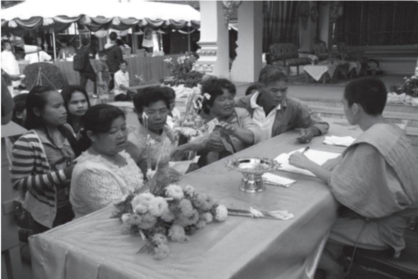
ภาพที่ ๑๑ บางส่วนของข้าโอกาสที่นำเงินมาเสียดำหัว

สำคัญอีกอย่างคือ เพื่อเป็นการสงสว่ยให้กับกษัตริย์ทั้ง ๕ พระองค์อันได้แก่ พญาสุวรรณภิงคารเจ้าเมืองหนองหารหลวง พญาคำแดง เจ้าเมืองหนองหารน้อย พญาอินทปัฐนครเจ้าเมืองอินทปัฐ พญาจุลณีพรหมทัตเจ้าเมืองจุลณี และพญานันทเสน เจ้าเมืองศรีโคตรบูร ๑๐ ที่ร่วมกันสร้างพระธาตุพนม และบริจาคข้าทาสบริวาร เพื่อให้อยู่ดูแลรักษาพระธาตุพนม ซึ่งตามความเชื่อของกลุ่มข้าโอกาสแล้วองค์พระธาตุพนมคือ สัญลักษณ์ตัวแทนของกษัตริย์ทั้ง ๕ พระองค์ นั่นเอง ซึ่งถ้าพระธาตุพนมยังอยู่ก็แสดงให้เห็นว่าวิญญาณของกษัตริย์ทั้ง ๕ พระองค์ ยังคงวนเวียนช่วยเหลือเหล่าบริวารของพระองค์ ซึ่งก็คือกลุ่มข้าโอกาส