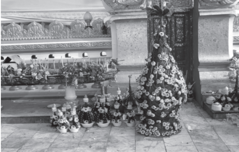
ภาพที่ ๘ ชั้นมหากเบ็งแต่ละขนาดที่เข้าโอกาสนำมาถวายแด่พระธาตุพนม

ที่สถิตอยู่ ณ ที่นั้น พร้อมด้วยวิญญูณของกษัตริย์ทั้งหลายที่ร่วมกันสร้างพระธาตุพนม ชั้นมหากเบ็งจึงเป็นสัญลักษณ์ของเครื่องยืนยันถึงความจงรักภักดี ความอ่อนน้อม เพื่อขอให้ดวงวิญญูณที่สถิตอยู่ที่พระธาตุพนมช่วยคุ้มครอง ปกป้องรักษาสมาชิกใน ครอบครัวให้มีแต่ความสุข และปลอดภัย รวมไปถึงสัตว์เลี้ยง และพืชพันธุ์ธัญญาหาร ให้อุดมสมบูรณ์ ฟ้าฝนตกต้องตามฤดูกาล ให้มีแต่ความอุดมสมบูรณ์ตลอดไป