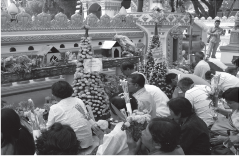
ภาพที่ ๗ กลุ่มเข้าโอกาสร่วมกันถวายข้าวพืษภาคแด่องค์พระธาตุพนม

ผู้วิจัยพบว่าพิธีกรรมถวายข้าวพืษภาคและเสียค่าหัว มีวัตถุประสงค์ลักษณะที่ส่งผ่านความหมายทางวัฒนธรรมหลายอย่างซึ่งได้แก่