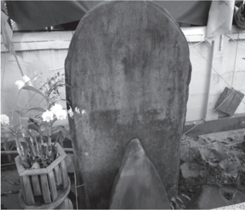
ภาพที่ ๔ จารึกวัดพระธาตุพนม ๒ พ.ศ. ๒๑๕๗ กล่าวถึงการอุทิศข้าโอกาสสองพระยานครหลวงพิชิตราชธานี

รัชสมัยพระยานครหลวงพิชิตราชธานี (พ.ศ. ๕๐๐ ) แห่งเมืองศรีโคตรบูร ได้กำหนดที่ดินที่อยู่ให้กับข้าโอกาสเพื่อให้ตั้งถิ่นฐานไว้ดังนี้ ฝั่งซ้ายแม่น้ำโขง ได้แก่ บ้านนาสะตือ บ้านนาวาง บ้านนาตาลเทิง บ้านผักเพื้อ บ้านดงนอกและบ้านดงใน พระองค์จึงได้ตั้งให้คนเหล่านั้นให้อุปัฏฐากพระธาตุต่อไป ส่วนทางฝั่งขวาแม่น้ำโขง อยู่บริเวณบ้านหนองปิง บ้านดงภู บ้านน้ำก่ำ บ้านหัวดอน และบ้านหมื่นหยาบ เขตอำเภอดงหลวง ๔ จังหวัดนครพนม