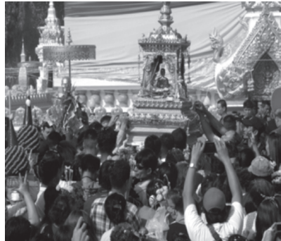
ภาพที่ ๑๕ พระอุปคุตและขบวนแห่ในงานนมัสการพระธาตุพนม

การถวายข้าวพืชภาคและเสียค่าหัว หมายถึงสัญลักษณ์และหน้าที่ของข้าโอกาส ที่สำนึกว่าตนเองเป็นข้าทาสบริวารของพระธาตุพนม โดยการถวายข้าวพืชภาค เป็นการนำผลผลิตของพืชที่ได้จากที่ดินของวัดบางส่วนที่ตนเองใช้ทำมาหากิน ส่งคืนให้กับเจ้าของที่ดินเพื่อเป็นค่าเช่าให้กับทางวัด ซึ่งหมายถึงส่งภาษีเป็นพืชพันธุ์ให้แก่กษัตริย์ทั้ง ๕ พระองค์ ที่ร่วมกันสร้างพระธาตุพนม นอกจากนี้การเสียค่าหัว ก็หมายถึงการเสียภาษีที่ดินให้กับเจ้านายที่อุทิศที่ดินโดยมีองค์พระธาตุพนมเป็นตัวแทน