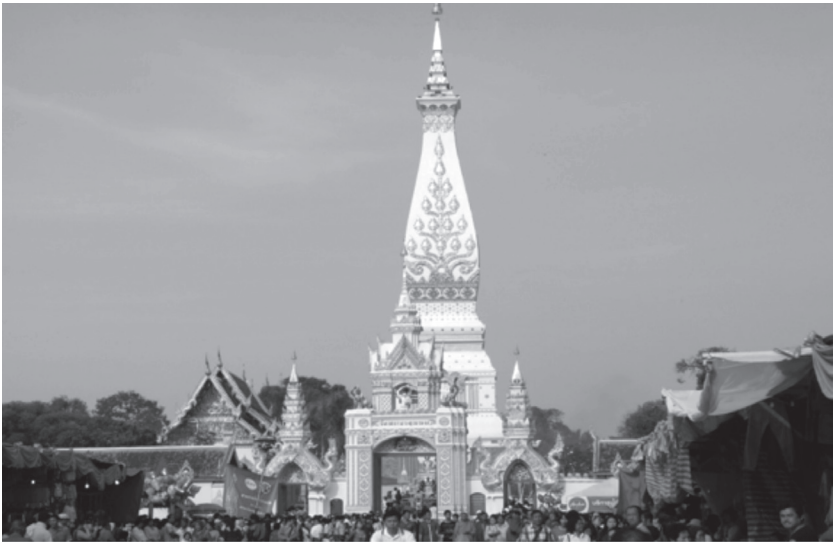
ภาพที่ ๑๒ ประชาชนร่วมงานนมัสการพระธาตุพนม ปี พ.ศ. ๒๕๕๖

พระธาตุพนมปีใด กลุ่มข้าโอกาสจะเพิ่มจำนวนขึ้นเรื่อยๆ ทั้งนี้เหตุผลหนึ่งคือองค์พระธาตุพนมเป็นที่พึ่งทางใจของพวกเขาในเวลาที่พักผ่อนหรือเหนื่อยล้า พวกเขาจะมากราบขอพรและเมื่อสิ่งที่พวกเขามาขอได้สำเร็จ ผลสำเร็จ ความศรัทธาและความเชื่อที่ยิ่งทวีขึ้นเรื่อยๆ นอกจากนี้บทบาทของกลุ่มข้าโอกาสที่ถูกกำหนดมาตั้งแต่ครั้งโบราณเพื่อให้ดูแลพระธาตุและพระภิกษุสงฆ์ภายในวัดพระธาตุพนม ก็ยิ่งเพิ่มความสำคัญให้กับพวกเขามากยิ่งขึ้น เมื่อถึงคราวจัดงานนมัสการพระธาตุพนมปีใด กลุ่มข้าโอกาสก็เป็นทั้งแรงงานและผู้วางแผนการจัดงาน มีการแบ่งกลุ่มผู้รับผิดชอบภายในงานอย่างชัดเจนเพื่อให้งานนมัสการพระธาตุพนมบรรลุตามวัตถุประสงค์ แม้แต่ในช่วงเวลาปกติ ซึ่งวัดพระธาตุพนมเป็นวัดใหญ่ที่มีพระภิกษุจำนวนมากแม้แต่พระภิกษุสามเณรที่อยู่ฝั่งซ้ายแม่น้ำโขงก็ได้มาพึ่งพาอาศัยวัดพระธาตุพนมเป็นที่เล่าเรียนเนื่องจากภายในวัดพระธาตุพนมเป็นทั้งสำนักเรียนพระปริยัติธรรม และมีมหาวิทยาลัยสงฆ์คือมหาจุฬาลงกรณราชวิทยาลัยตั้งอยู่ในวัดพระธาตุพนม และพร้อมกันนี้ก็มีทั้งกลุ่มฆราวาสที่อาศัยอยู่ในวัดและรอบๆ บริเวณวัดดังนั้นเมื่อมีผู้คนมากขึ้นจึงเป็นสิ่งจำเป็นที่จะต้องมียุวกษัตริย์ดูแลความสะอาดองค์พระธาตุพนม