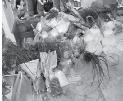
ภาพที่ ๖ ข้าโอกาสนำข้าวพิษภาคมาถวายแด่พระธาตุพนม

โดยปกติการแสดงตัวตนของข้าโอกาสเป็นสิ่งยากที่จะพบเห็น เพราะความหมายของคำว่า “ข้าโอกาส” มีนัยยะในทางลบ ยิ่งลูกหลานข้าโอกาสที่สืบทอดกันมามากจะไม่ค่อยแสดงตัว ยกเว้นในวันขึ้น ๘ ค่ำ เดือน ๓ (กุมภาพันธ์) ซึ่งเป็นวันแรกของงานนมัสการประจำปีพระธาตุพนม ข้าโอกาสจะรวมตัวกันที่หมู่บ้านของตนเองเพื่อสร้างเครื่องบูชาพระธาตุพนม ซึ่งได้แก่ ชันหมากเบ็ง และเทียนรอบหัวคาคิง