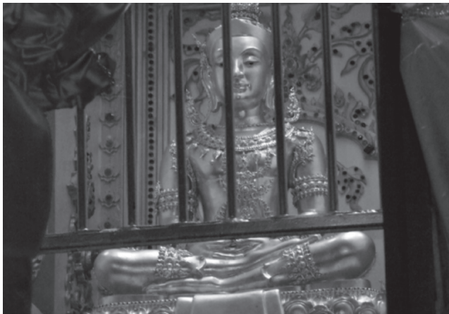
ภาพที่ ๑๔ พระพุทธรูปพระรัตนมหารมณี พระพุทธรูปที่ประดิษฐานอยู่ในองค์พระธาตุพนม

นอกจากข้าวแล้วยังมีองค์ประกอบที่ทำให้ความเป็นข้าโอกาสสมบูรณ์คือ พืชสวนและพืชไร่ต่างๆ เช่น พริก หอม มันแกว และพืชไร่ตามฤดูกาล ได้แก่ มะขามแตงโม สิ่งเหล่านี้ถือได้ว่าเป็นองค์ประกอบที่ทำให้ “ข้าวพืชภาค” สมบูรณ์ ซึ่งจะขาดอย่างใดอย่างหนึ่งไม่ได้ แต่การนำองค์ประกอบเหล่านี้มาถวายขึ้นอยู่กับฤดูกาล เช่นในบางปีอาจจะมึกล้วย อ้อย หรือมะพร้าว เสริมเข้ามา เพื่อเป็นองค์ประกอบให้สมบูรณ์ยิ่งขึ้น