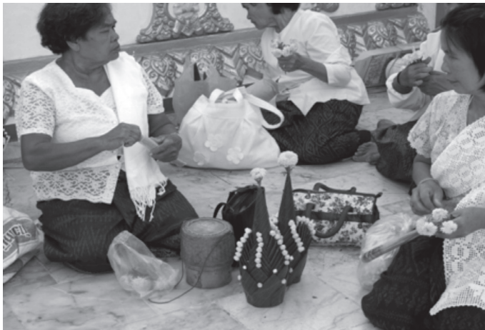
ภาพที่ ๕ ข้าโอกาสวัดพระธาตุพนมนำขึ้นหมากเบ็งมาถวายพระธาตุพนม

การอุทิศข้าโอกาสให้เป็นสมบัติของวัดพระธาตุพนมไม่ได้จำกัดจำนวนทั้งนี้ขึ้นอยู่กับฐานะของผู้บริจาค เมื่อข้าโอกาสมีจำนวนมากขึ้นจึงต้องมีการจัดระเบียบโดยใช้ความเชื่อ ประเพณีและศาสนาเป็นเกณฑ์ในการจัดระเบียบ ข้าโอกาสจึงเป็นบุคคลที่ไม่ต้องเสียภาษีหรือส่วยให้กับทางราชการ และไม่ถูกเกณฑ์แรงงาน เพราะเป็นสมบัติของพระศาสนา ดังนั้นบางวัดที่มีผู้อุทิศข้าโอกาสให้ดูแลวัดจำนวนมากจึงต้องมีการจัดระเบียบข้าโอกาสขึ้นและมีการตั้งหัวหน้าเพื่อปกครองดูแลกันขึ้นในสมัยรัชกาลที่ ๓ ได้มีหัวหน้าคนแรกที่ตั้งขึ้นชื่อว่า “ขุนโอกาส” เป็นหัวหน้ากลุ่มข้าโอกาสวัดพระธาตุพนม แต่ต่อมาเมื่อข้าโอกาสมีจำนวนมากขึ้นจึงต้องมีหัวหน้า ๒ คน คือ พระพิทักษ์เจติย์ ซึ่งขึ้นกับเมืองละคอน (นครพนม) และหลวงภูษารัตน์ปลัดกลางขึ้นกับเมืองบังมุก (มุกดาหาร)