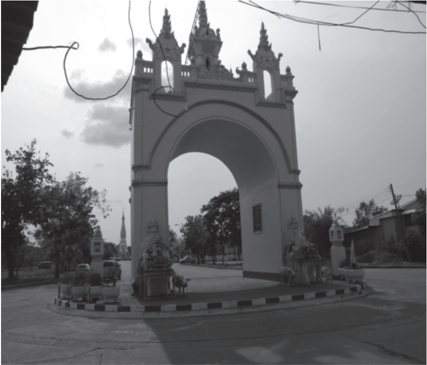
ภาพที่ ๒ ซุ้มประตูเรื่องอร่ามรัชฎากร ทางเข้าวัดพระธาตุพนมสร้างโดยพระครูศีลาภีรต์ พ.ศ.๒๔๗๐