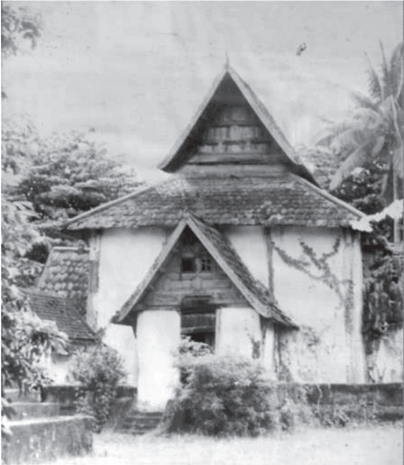
หอเสาอินทซิล เมืองเชียงใหม่ (ที่มา : วัดเจดีย์หลวงวรวิหาร จังหวัดเชียงใหม่)

ทางเข้า ๒ ข้างประตูเมืองทั้ง ๕ แจ่งเวียงทั้ง ๔ และกลางเวียง จารึกเป็นยันต์ต่างๆ กลับหัวกลับข้างเหมือนเงาในกระจก เพื่อให้เกิดความสุขสวัสดิ์แก่ชาวเมืองและ