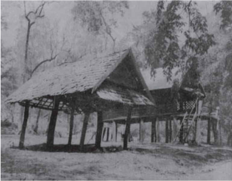
หอนิเวศน์ที่บ้านถ้ำ อำเภอดอกคำใต้ จังหวัดพะเยา (ที่มา : วัดสุวรรณคูหา จังหวัดพะเยา)

(๓) “ผีเจ้าบ้าน” หรือ “ผีเสื้อบ้าน” หรือ “ผีเสี่ยวบ้าน” คือผีอารักษ์หมู่บ้าน อาจเป็นผีดั้งเดิมก่อนเข้ามาตั้งชุมชน อดีตผู้นำ หรือ วีรบุรุษของหมู่บ้านเมื่อสิ้นชีวิตลง ก็ได้ยกขึ้นเป็นผีเจ้าบ้าน ปริณทลอำนาจจะเหนือกว่าผีเรือนและผีเจ้าที่ มีการผลิตซ้ำความเชื่อทุกปีด้วยพิธีกรรมดำหัวผีเจ้าบ้านช่วงปีใหม่(สงกรานต์)หรือเมื่อมีการขนานเหมือนกับผีระดับอื่นๆ ถือว่าผีเจ้าบ้านเป็นผีที่ควบคุมควบคุมกับหน่วยการปกครองหมู่บ้าน เมื่อคนภายในหมู่บ้านออกไปไกลค้างแรมที่อื่นนอกจากบอกรักบ้านก็ต้องบอกรักผีเจ้าบ้านด้วย ดังนั้นผีเจ้าบ้านนอกจากเป็นที่ยึดเหนี่ยวจิตใจของชุมชนยังทำหน้าที่ควบคุมสมาชิกหมู่บ้านไม่ให้เกิดกฏระเบียบ ช่วยจัดระเบียบเชื่อมรักษาความสัมพันธ์ระหว่างกลุ่มเครือญาติหรือกลุ่มตระกูลต่างๆ ให้อยู่ร่วมกันอย่างปกติสุขภายในหมู่บ้าน บางหมู่บ้านจะมีม้าขี่เป็นสื่อกลางเหมือนผีปู่ย่าและผีเมือง หากบางหมู่บ้านไม่มีม้าขี่ก็ใช้สัญลักษณ์แทน เช่น หอผี ต้นไม้ใหญ่ หรือจอมปลวก เป็นต้น