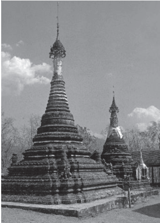
พระธาตุจอมแจ้ง เมืองยวม พ.ศ. ๒๕๑๑

(๑) เมืองลونغ (อำเภอลونغ อำเภอวังขึ้น และบางส่วนอำเภอเด่นชัย จังหวัดแพร่) ปรากฏมีการสถาปนา “ระบบพระธาตุประจำพระเจ้าห้าพระองค์” เป็นการจัดพระธาตุให้เป็นระบบตามคติพระเจ้าห้าพระองค์ที่จะเสด็จตรัสรู้ในภัทรกัปนี้ คือ พระธาตุโอสร์ร้อย (บ้านโอสร์ร้อย ตำบลปากกาง อำเภอลونغ) ประจำพระกฤษณะและพระโกนาคมะ พระธาตุขวยปู (บ้านแม่ป้าก ตำบลแม่ป้าก อำเภอวังขึ้น) ประจำพระกัณเฑาะ พระธาตุแหลมลี่ (ตำบลปากกาง อำเภอลونغ) ประจำพระโคตมะ และพระธาตุปู่ต๊ับ (ตำบลทุ่งแล้ง อำเภอลونغ) ประจำพระศรีอริยมุตตรัย ๓๓