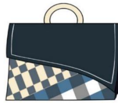
กระเป๋าถือแบบที่ 7