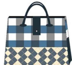
กระเป๋าถือแบบที่ 8