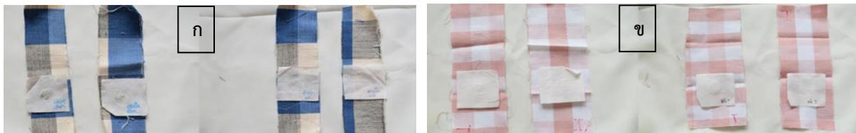
รูปที่ 3 แสดงภาพขึ้นทดสอบความคงทนของสีต่อการขัดถู