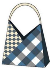
กระเป๋าถือแบบที่ 5