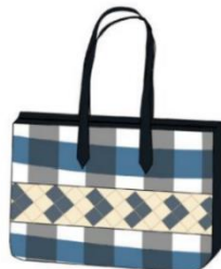
กระเป๋าถือแบบที่ 6