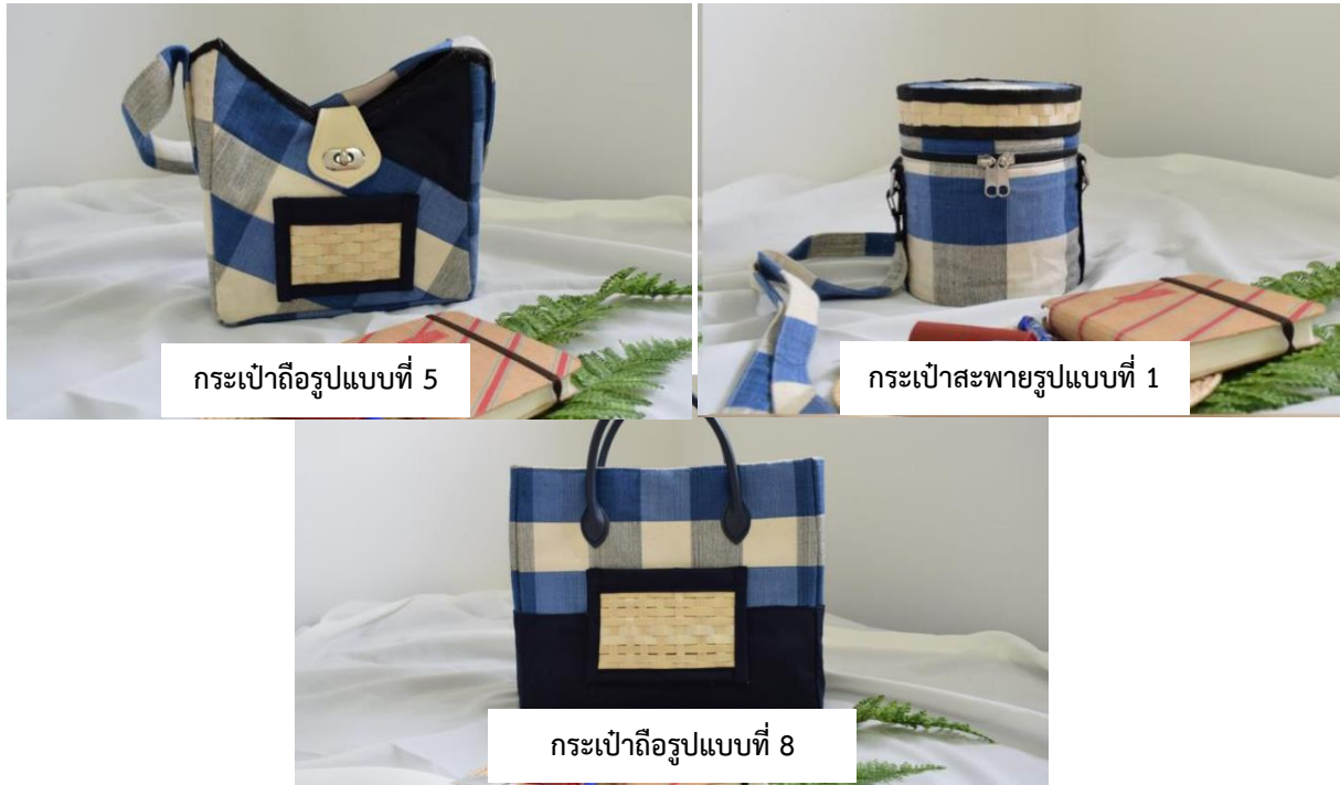
รูปที่ 7 แสดงภาพกระเป๋าต้นแบบจากผ้าขาม้า บ้านปางคอม จังหวัดน่าน