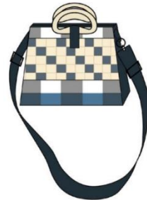
กระเป๋าสะพายแบบที่ 3