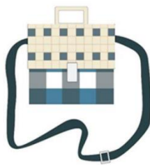
กระเป๋าสะพายแบบที่ 2