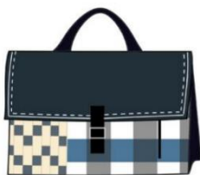
กระเป๋าถือแบบที่ 9