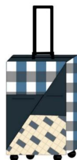
กระเป๋าเดินทางแบบที่ 11