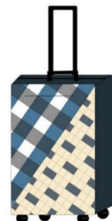
กระเป๋าเดินทางแบบที่ 12