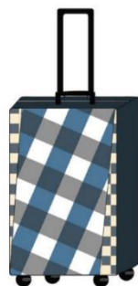
กระเป๋าเดินทางแบบที่ 10