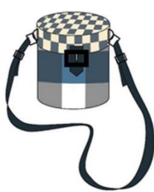
กระเป๋าสะพายแบบที่ 1

เมื่อผู้วิจัยทดสอบคุณสมบัติทางวิทยาศาสตร์เบื้องต้นของผ้าขาวม้า บ้านปางคอม จังหวัดน่าน เพื่อนำมาพัฒนาและออกแบบผลิตภัณฑ์กระเป๋า โดยมีการทำแบบร่างต้นแบบกระเป๋า จำนวน 12 แบบ โดยแบ่งเป็น กระเป๋าสะพาย 4 รูปแบบ กระเป๋าถือ 5 รูปแบบ และกระเป๋าเดินทาง 3 รูปแบบ เพื่อให้ผู้เชี่ยวชาญทางด้านการออกแบบผลิตภัณฑ์สิ่งทอ จำนวน 4 ท่าน ได้คัดเลือกและนำไปสำรวจกับกลุ่มตัวแทนผู้บริโภค โดยมีแบบร่างกระเป๋าดังต่อไปนี้