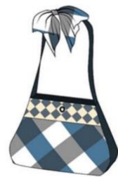
กระเป๋าสะพายแบบที่ 4