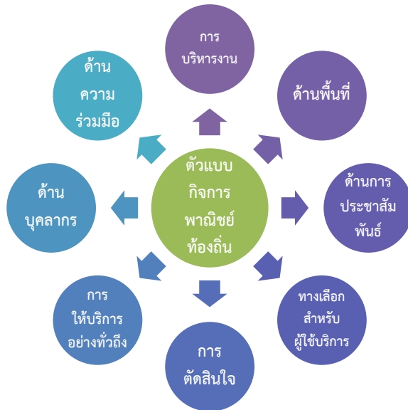
ภาพที่ 2 ตัวแบบการประกอบการพาณิชย์ท้องถิ่น