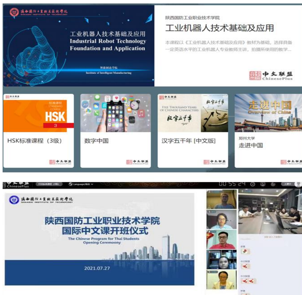
图 1 中文联盟平台的“中文+职业”MOOC 的国际化课程课程

的课程，并与合作单位中文国际联盟平台培训合作单位的教师合作。同时，职业院校可以将“中文+职业教育”高质量视频课程上传至“中国+职业教育”部分。中文国际联盟平台将通过新的媒体平台进行推广。合作高校将被纳入中文国际联盟平台“美丽中国学习计划”，以推广学校、特色专业和课程。职业 MOOC 课程的国际化已经启动，“工业机器人技术的基础与应用”课程已经建立在中国联盟平台的“中文+职业教育”部分，为来自世界各地的学生提供高质量的在线职业课程。同时，开展“直播+点播”网络课程，其中有 20 名泰国学生，7 月 27 日起持续了 5 个月，课程主要通过陕西国防工业高职独家“中文+职业教育”网络课程服务平台，包括现场班 HSK 标准课程 4 级、工业机器人技术基础和应用等层次 HSK 标准课程和中国文化课程及当代国情，平台为泰国学生提供了更高效、方便的学习体验。如图 1 所示：