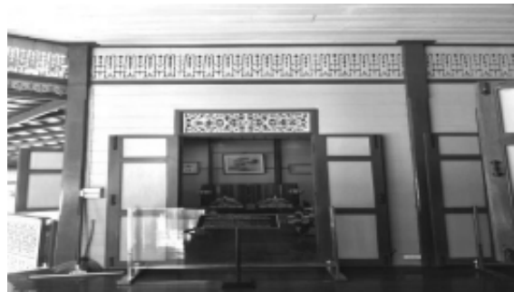
รูปที่ 1 ลวดลายไม้ฉลุที่บริเวณคอสอง และเหนือประตูเรือนพระรัตนศวร จ.นครปฐม

อีกลักษณะคือ ลวดลายที่เกิดจากช่องว่าง หรือช่องฉลุ ซึ่งส่วนใหญ่เป็นลายในแนวตั้งของแผ่นไม้ ซึ่งการฉลุนี้ก็มีการฉลุเป็นช่องปิดในรูปแบบต่างๆ และการฉลุเป็นช่องเปิดที่ต้องนำไม้แผ่นอื่นที่มีลวดลายและแบบเปิดที่สัมพันธ์และนำมาประกอบเข้าด้วยกัน จึงจะได้รูปแบบลวดลายที่สมบูรณ์และต่อเนื่องกันไป ซึ่งลวดลายแบบขนมปังขิงในลักษณะเช่นนี้ มีทั้งแบบอย่างที่เป็นไม้ แผ่นข้อฉลุ ซ้าย-ขวาเหมือนกัน นำมาเรียงต่อกันไปหรือแบบที่ซ้ายขวาสลับข้างกันและนำมาเรียงสลับกัน (กล่าวคือมี 2 แบบลายและอีกลักษณะหนึ่งคือแบบลายในช่องปิด เป็นลวดลายจบในแผ่นแต่นำมาเรียงต่อกัน