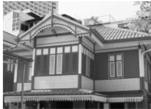
รูปที่ 7 ลวดลายไม้ฉลุที่หน้าจั่วอาคารกุฏิเจ้าอาวาส วัดสวนพลู