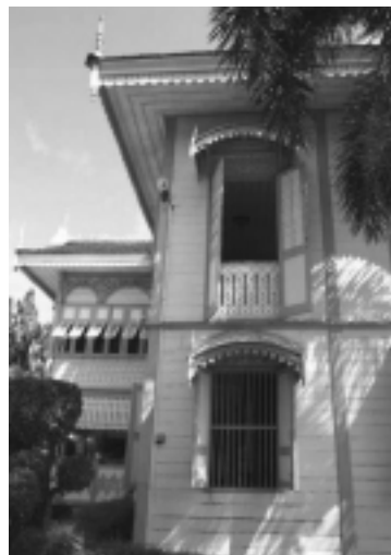
รูปที่ 2 ลวดลายไม้ฉลุที่หน้าต่างบ้านวงศ์บุรี จ.แพร่