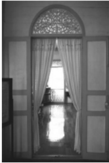
รูปที่ 3 ลวดลายไม้ฉลุแบบขนมปังขิงที่เหนือประตูบ้านวงศ์บุรี จ.แพร่