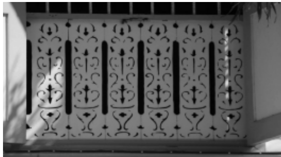
รูปที่ 4 ลวดลายไม้ฉลุลวาระเบียงบ้านวงศ์บุรี จ.แพร่