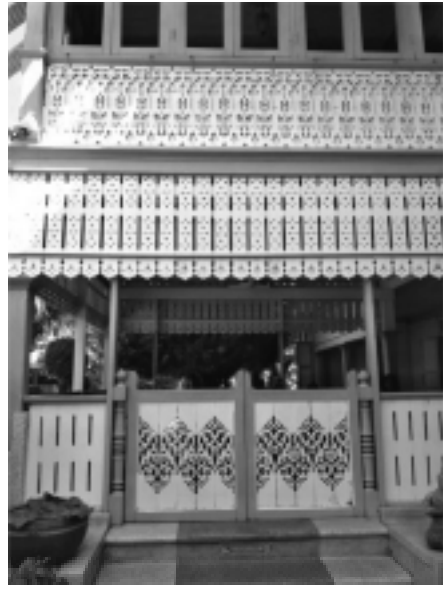
รูปที่ 6 ประตูบานเปิดเตี้ยด้านหน้าและกันสาดบ้านวงศ์บุรี จ.แพร่