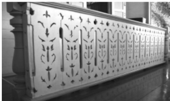
รูปที่ 5 ลวาระเบียงบันไดที่บ้านวงศ์บุรี จ.แพร่