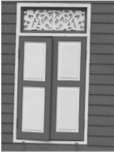
รูปที่ 9 ลวดลายไม้ฉลุที่เหนือหน้าต่างบ้านเปิด วัดสวนพลู