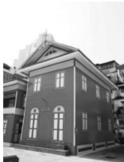
รูปที่ 8 ลวดลายไม้ฉลุที่เหนือหน้าต่าง อาคารโรงเรียนพันรชาคาร วัดสวนพลู