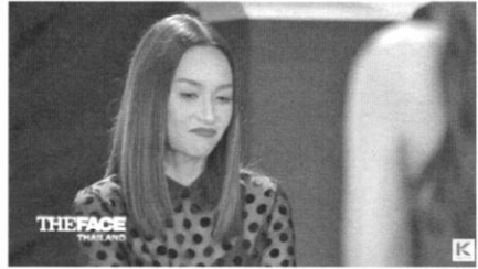
ภาพที่ ๓ แสดงการเสวยอิมและการเบ้าปากของเมนเทอร์ในห้องดำ

(season 3 ep.10 ๘ เมษายน ๒๕๖๐ และ season 2 ep.3 ๓๑ ตุลาคม ๒๕๕๙)