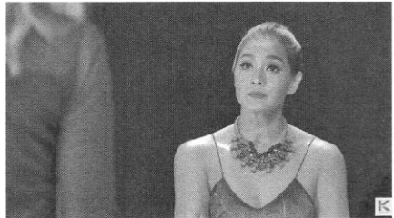
ภาพที่ ๒ แสดงการใช้สายตาและสีหน้าของเมนเทอร์ในห้องดำ