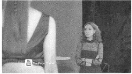
ภาพที่ ๑ แสดงการกอดอกของเมนเทอร์ในห้องดำ