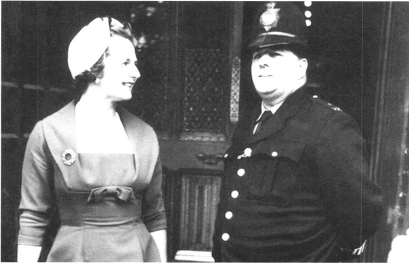
มาร์กาเรต แทตเชอร์ เมื่อแรกเริ่มเป็นสมาชิกสภาสามัญ

ใน ค.ศ. ๑๙๕๐ และ ค.ศ. ๑๙๕๑ แทตเชอร์ลงลงนามการเมืองโดยการสมัครรับเลือกตั้งในสังกัดพรรคอนุรักษนิยมที่เมืองดาร์ตฟอร์ด (Dartford) มณฑลเคนต์ (Kent) แต่ก็ไม่ประสบความสำเร็จ จนกระทั่ง ค.ศ. ๑๙๕๙ จึงได้รับเลือกตั้งเป็นสมาชิกสภาสามัญจากเขตฟินช์ลีย์ (Finchley) ซึ่งเป็นเขตฐานเสียงของพรรคอนุรักษนิยมที่อยู่ชานกรุงลอนดอนไปทางเหนือ และเป็นผู้แทนของเขตนี้ไปจนลาออกจากสภาสามัญใน ค.ศ. ๑๙๙๒ เมื่อแรกเข้าสภาในวัย ๓๔ ปี แทตเชอร์เป็นสตรีที่มีอายุน้อยที่สุดในสภาสามัญ ไม่นานต่อมา เธอได้ดำรงตำแหน่งรัฐมนตรีช่วยว่าการกระทรวงเงินบำนาญสงเคราะห์และการประกันแห่งชาติ (Ministry of Pensions and National Insurance) ในสมัยรัฐบาล