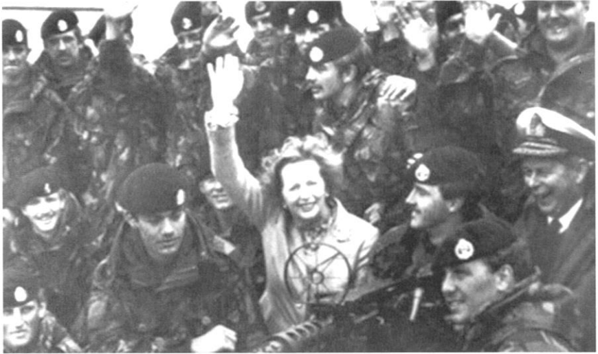
มาร์กาเรต แทตเซอร์ กับทหารที่เข้าร่วมในสงครามชิงหมู่เกาะฟอล์กแลนด์

และนำคำว่า 'Great' กลับมาสู่คำว่า 'Britain' อย่างภาคภูมิใจ คณะนิยามในตัวแทตเซอร์ จึงกลับพุ่งขึ้นสูงและทำให้เธอนำพรรคผู้ชัยชนะในการเลือกตั้งทั่วไปครั้งที่ ๒ เป็นผล สำเร็จ