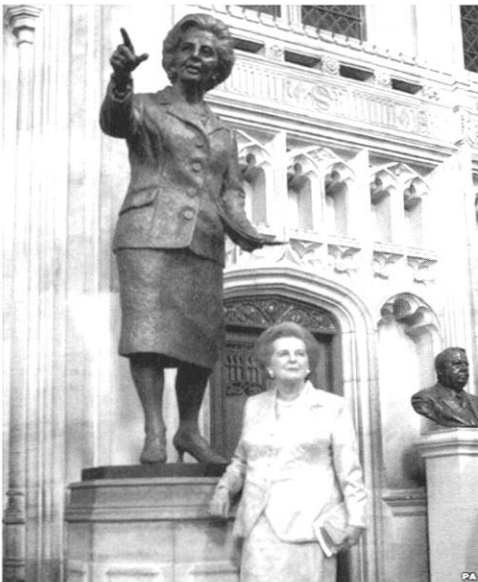
มาร์กาเรต แทตเชอร์ ในวันที่เปิดผ้าคลุมรูปปั้นตัวเธอในสภาสามัญ

ในเดือนกุมภาพันธ์ ค.ศ. ๒๐๐๗ บารอนเนสแทตเชอร์รับเชิญไปเปิดผ้าคลุมรูปปั้นตัวเธอเองที่รัฐสภาอังกฤษสั่งทำและให้ติดตั้งในสภาสามัญ นับว่าเธอเป็น