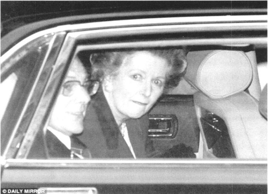
แทตเชอร์นำตากล้องเมื่อนั่งรถออกจากทำเนียบนายกรัฐมนตรีกับเดนิส แทตเชอร์สามีผู้อยู่เคียงข้าง เป็นกำลังใจให้เธอตลอดมา

ในวันที่ ๒๘ พฤศจิกายน แทตเชอร์ย้ายออกจากทำเนียบนายกรัฐมนตรี เลขที่ ๑๐ ถนนดาวนิง (10 Downing Street) ด้วยความรู้สึกผิดหวังอย่างมากกับนักการเมืองร่วมพรรค พรรคอนุรักษนิยมมีจอห์น เมเจอร์ ขึ้นมาเป็นผู้นำพรรคแทนซึ่งแทตเชอร์ก็สนับสนุนเขามากกว่าผู้สมัครรายอื่น (เธอกล่าวในภายหลังว่าเป็นการตัดสินใจที่ผิดพลาด) เมเจอร้นำพรรคอนุรักษนิยมที่ปรับวิธีดำเนินนโยบายให้ฟังเสียงและประนีประนอมกับผู้ออกเสียงเลือกตั้งมากขึ้นจนได้รับชัยชนะอีกครั้งในการเลือกตั้งเดือนเมษายน ค.ศ. ๑๙๙๒ ก่อนที่จะพ่ายแพ้เป็นเวลายาวนานให้แก่พรรคแรงงานในช่วง ค.ศ. ๑๙๙๗-๒๐๑๐