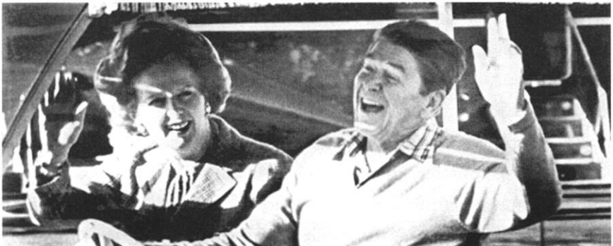
มาร์กาเร็ต แทตเชอร์กับ โรนัลด์ เรแกน

ส่วนในด้านการต่างประเทศ อังกฤษสมัยแทตเชอร์ดำเนินนโยบายเป็นพันธมิตรใกล้ชิดกับสหรัฐอเมริกา แทตเชอร์มีความสัมพันธ์อันดีกับประธานาธิบดีโรนัลด์ เรแกน เธอจึงมีส่วนเสริมสร้างความสัมพันธ์อันดีระหว่างเรแกนกับมีฮาอิล กอร์บาชอฟ (Mikhail Gorbachev) ผู้นำของสหภาพโซเวียตอันเป็นดินแดนที่ครั้งหนึ่งเรแกนเคยเรียกว่าจักรวรรดิชั่วร้าย (Evil Empire) การเปลี่ยนทัศนคติที่มีต่อสหภาพโซเวียตนำไปสู่การสิ้นสุดของสงครามเย็น (Cold War) ในด้านอื่น แม้แทตเชอร์คงยอมรับในพันธะที่อังกฤษมีต่อองค์การสนธิสัญญาแอตแลนติกเหนือหรือนาโต (North Atlantic Treaty Organization-NATO) แต่เธอก็ยืนยันการมีนโยบายนิวเคลียร์ที่เป็นอิสระของอังกฤษ ซึ่งเป็นที่พอใจของประชาชน