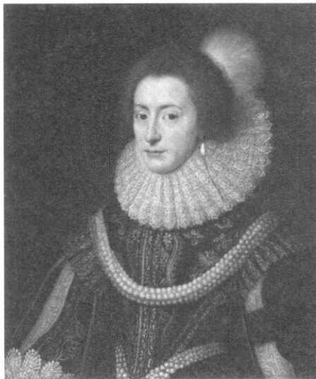
สมเด็จพระราชินีเอลิซาเบทแห่งโบฮีเมีย หรืออดีตเจ้าหญิงเอลิซาเบท ราชกุมารีทรงเป็น พระราชธิดาในพระเจ้าเจมส์ที่ ๑ และทรงเป็น พระอัยกี (ยาย) ในพระเจ้าจอร์จที่ ๑ ที่ประสูติ จากเจ้าหญิงโซเฟียอเล็กซานดราแห่งแซนโนเวอ์ พระราชธิดาพระองค์เล็ก