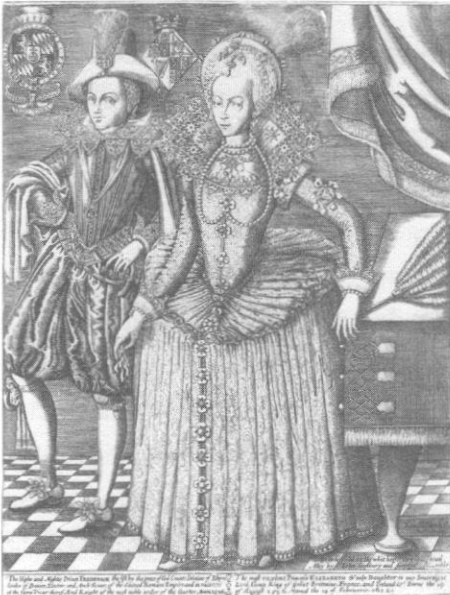
เจ้าหญิงเอลิซาเบทราชกุมารีกับเฟรเดอริกที่ ๕ อิลเล็กเตอร์แห่งพาลาทิเนทหรือต่อมาคือพระเจ้าเฟรเดอริกแห่งโบฮีเมียพระสวามีทั้งสองพระองค์ทรงเป็น “สมเด็จพระเจ้า” ของพระเจ้าจอร์จที่ ๑ (ค.ศ. ๑๗๑๔-๑๗๒๕)

ท้ายที่สุด ราชสำนักอังกฤษได้เลือกดยุกเฟรเดอริกที่ ๕ อิลเล็กเตอร์แห่งพาลาทิเนท พระชันษา ๑๖ ปี และมีฐานะเป็นเจ้าราชรัฐพาลาทิเนทและอิลเล็กเตอร์มาแล้ว ๒ ปี เคานต์เฟรเดอริกที่ ๕ ทรงเป็นเจ้าชายระดับสูงในจักรวรรดิโรมันอันศักดิ์สิทธิ์ (a senior Prince of the Empire) ทรงเป็น ๑ ใน ๗ อิลเล็กเตอร์ที่มีสิทธิ์ในการเลือกจักรพรรดิแห่งจักรวรรดิโรมันอันศักดิ์สิทธิ์ ทั้งทรงสืบเชื้อสายมาจากราชวงศ์เก่าแก่หลายราชวงศ์ด้วยกัน ทั้งเคานต์เฟรเดอริกที่ ๕ ยังทรงอยู่ในฐานะที่จะเป็น “ผู้นำสูงสุดของกลุ่มโปรเตสแตนต์”