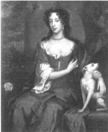
สมเด็จพระราชินีแมรีแห่งโมดินา พระมเหสีจากการเสกสมรสในครั้งที่ ๒ ของพระเจ้าเจมส์ที่ ๒ ทรงนับถือนิกายคาทอลิก