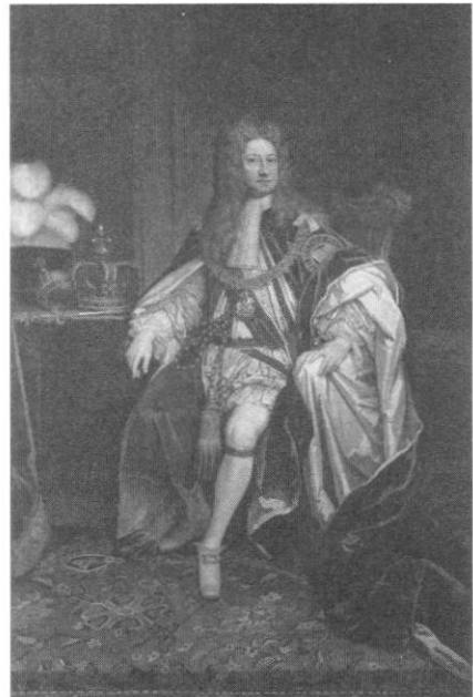
พระเจ้าจอร์จที่ ๑ (ค.ศ. ๑๗๑๔-๑๗๒๒)

สจวตเองก็ทำให้ทุกอย่างกระจ่างเมื่อพระองค์ยืนยันที่จะเป็นคาทอลิกต่อไปและตลอดไป ก่อนที่สมเด็จพระราชินีนาถแอนน์หรือที่ประชาชนอังกฤษเรียกติดปากว่า “ราชินีนาถแอนน์แสนดี” (Good Queen Anne) จะเสด็จสวรรคต ในเดือนพฤษภาคม ค.ศ. ๑๗๑๔ ทรงดำเนินการต่าง ๆ และแผ้วทางให้การสืบราชสันตติวงศ์เป็นไปตามพระราชบัญญัติการตกลงปรองดอง ค.ศ. ๑๗๐๑ และป้องกันการเกิดปัญหา อุปสรรคและความวุ่นวายใด ๆ ด้วยการแต่งตั้งสมาชิกเสียงข้างมากของพรรคทอริที่สนับสนุนการขึ้นครองราชย์ของราชวงศ์แฮโนเวอร์และพระราชบัญญัติการตกลงปรองดอง ค.ศ. ๑๗๐๑ ให้ดำรงตำแหน่งเสนาบดีสำคัญ ๆ ในคณะรัฐบาล เมื่อสมเด็จพระราชินีนาถแอนน์เสด็จสวรรคตในวันที่ ๑ สิงหาคม ค.ศ. ๑๗๑๔ ซึ่งนับเป็นการสิ้นสุดของราชวงศ์สจวต การเปลี่ยนผ่านของราชวงศ์สจวตสู่ราชวงศ์แฮโนเวอร์ซึ่งมีพื้นฐานความเชื่อในศาสนาเป็นโปรเตสแตนต์มาโดยตลอดก็เป็นไปอย่างราบรื่นตามกฎหมายและวิถีทางของรัฐสภา ปราศจากความวุ่นวายใด ๆ และไม่มีสงครามกลางเมืองอย่างที่หลายคนปริวิตก ทั้งนี้โดยหลังจากที่สมเด็จพระราชินีนาถเสด็จสวรรคตได้เพียง ๙ ชั่วโมง ดยุก จอร์จ อีเล็กเตอร์แห่งแฮ