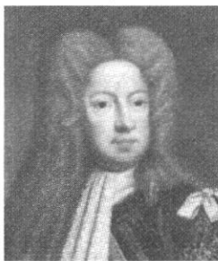
จอร์จที่ ๑ (๑๗๑๔-๑๗๒๗)