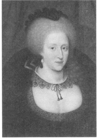
สมเด็จพระราชินีแอนน์แห่งเดนมาร์ก พระมเหสีในพระเจ้าเจมส์ที่ ๑