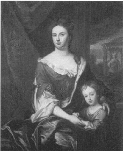
สมเด็จพระราชินีนาถแอนน์ (ค.ศ. ๑๗๐๒-๑๗๑๔) การสิ้นพระชนม์ของดุกแห่งกลอสเตอร์ พระราชโอรสใน ค.ศ. ๑๗๐๐ ทำให้มีการออกพระราชบัญญัติการตกลงประองดอง ค.ศ. ๑๗๐๑ เพื่อกำหนดผู้มีสิทธิในการสืบราชบัลลังก์อังกฤษ