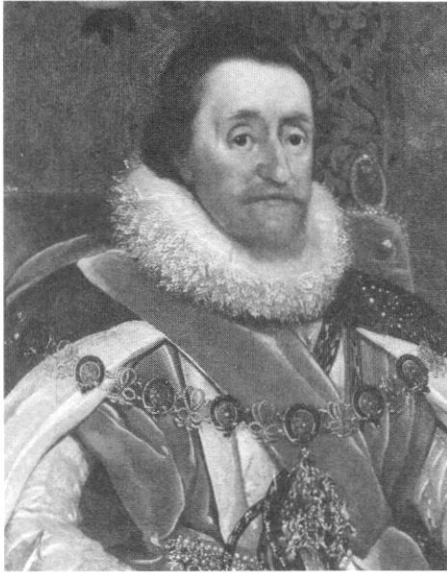
พระเจ้าเจมส์ที่ ๑ (ค.ศ. ๑๖๐๓-๑๖๒๕)