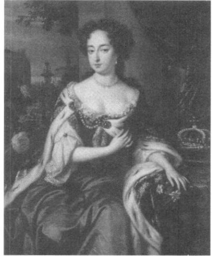
สมเด็จพระราชินีนาถแมรีที่ ๒ (ค.ศ. ๑๖๘๙-๑๖๙๕)