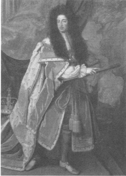
พระเจ้าวิลเลียมที่ ๓ (ค.ศ. ๑๖๘๙-๑๗๐๒)