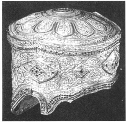
วัดราชบูรณะและสมบัติที่ค้นพบในกรุพระปรางค์