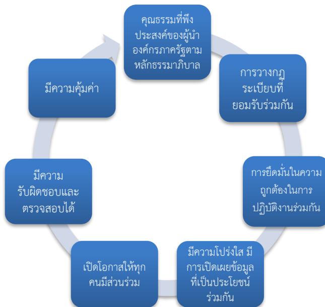
ภาพที่ 2 ความรับผิดชอบและคุณธรรมที่พึงประสงค์ ของผู้นำองค์กรภาครัฐตามหลักธรรมาภิบาล