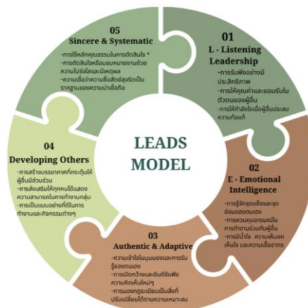
ภาพที่ 1 องค์ประกอบภาวะผู้นำร่วมสมัยของนักศึกษาปริญญาตรี

การวิจัยนี้ได้องค์ความรู้ที่ได้จากการวิจัยคือโมเดล LEADS เป็นกรอบแนวคิดภาวะผู้นำร่วมสมัยที่พัฒนาขึ้นเพื่อตอบสนองความต้องการในการพัฒนาภาวะผู้นำร่วมสมัยในนักศึกษาปริญญาตรี โดยประกอบด้วย 5 มิติหลักที่เชื่อมโยงและสนับสนุนซึ่งกันและกันในลักษณะพหุมิติ ซึ่งสะท้อนผ่านอักษรย่อ L-E-A-D-S ที่มีความหมายสอดคล้องกับการเป็นผู้นำที่แท้จริง ประกอบไปด้วย