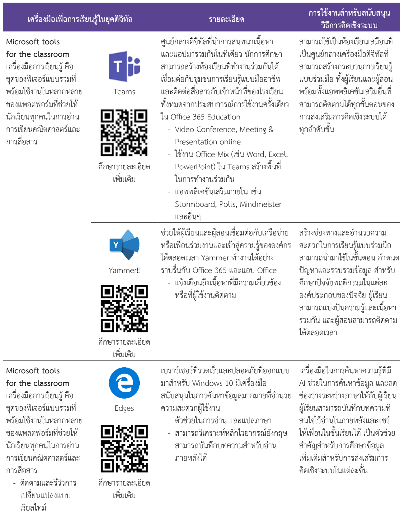
Table 1 Digital learning tools and how to applications for support in instructional of systems thinking.