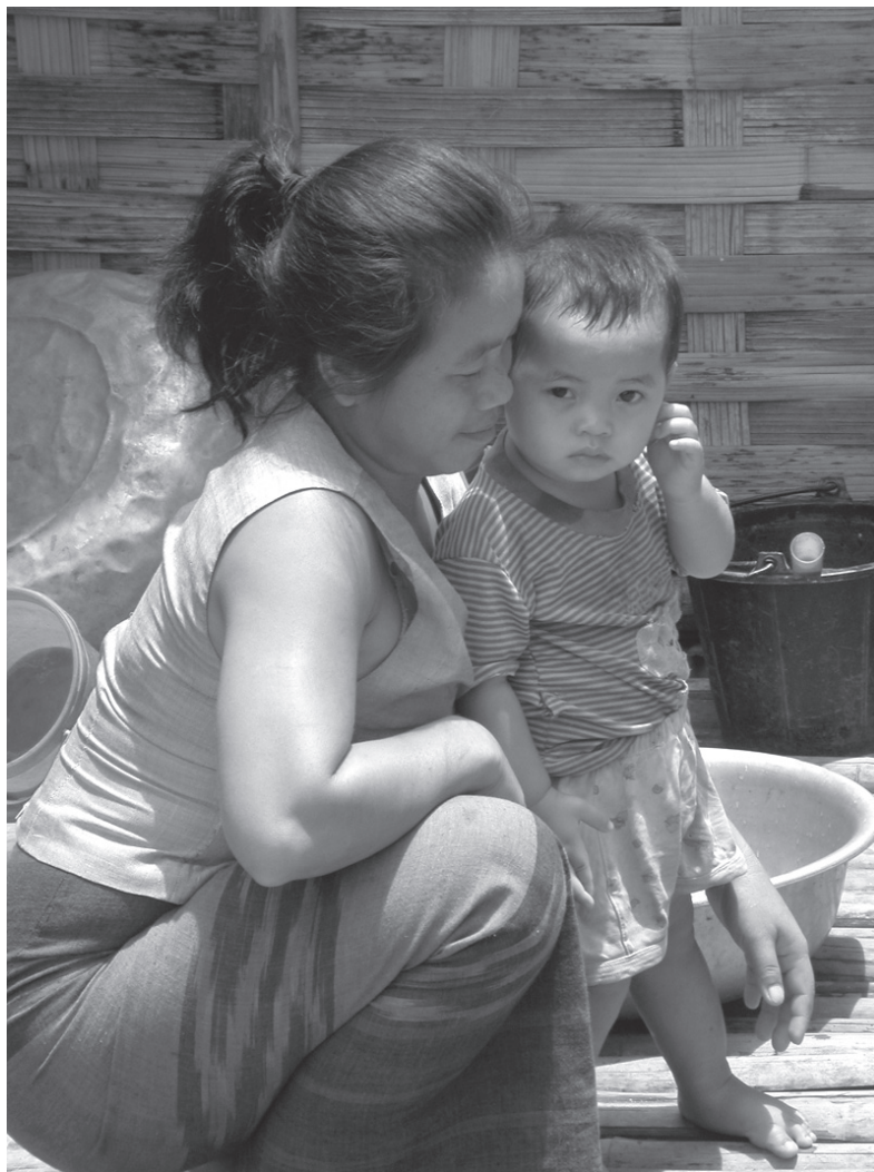
วิถีชีวิตชาวชนบทในประเทศลาว