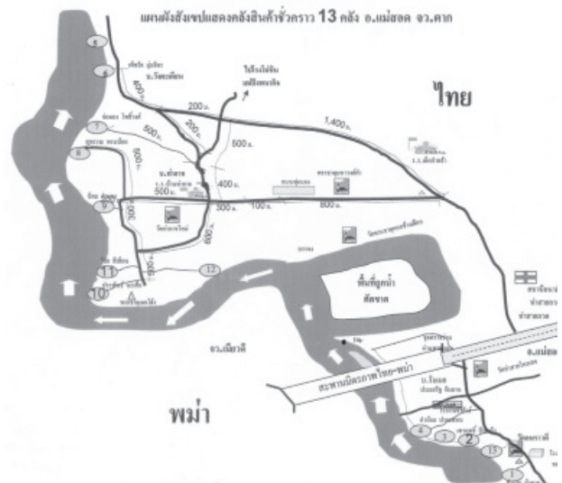
รูปที่ 2 แสดงแผนผังคลังสินค้าชั่วคราว อ.แม่สอด

อยู่ทั้งสิ้นจำนวน 19 ท่าเปิดให้ใช้จริง 14 ท่า ในปี 2549 ใช้ได้จริง 8 ท่า (จากการสัมภาษณ์นายด่านศุลกากร อำเภอแม่สอด, 2549)