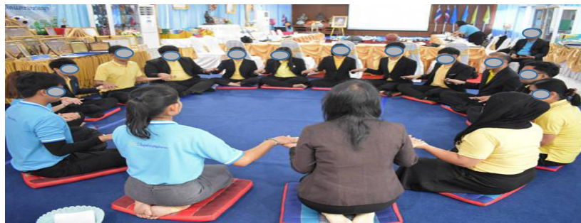
รูปที่ 2 บรรยากาศในระหว่างการอบรม จิตตปัญญาเพื่อเสริมสร้างความสามารถทางอารมณ์

(รูปที่ 2 และ 3) ด้านการใคร่ครวญ ด้านการฟังอย่างลึกซึ้ง ด้านการทำสมาธิ มีความแตกต่างอย่างมีนัยสำคัญทางสถิติ กล่าวคือ ค่าเฉลี่ย หลังการอบรม สูงกว่าก่อนการอบรม