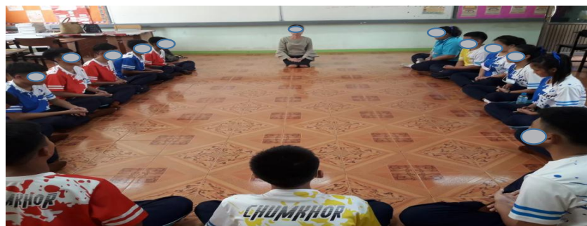
รูปที่ 3 บรรยากาศการจัดกิจกรรม จิตตปัญญา ให้กับนักเรียน