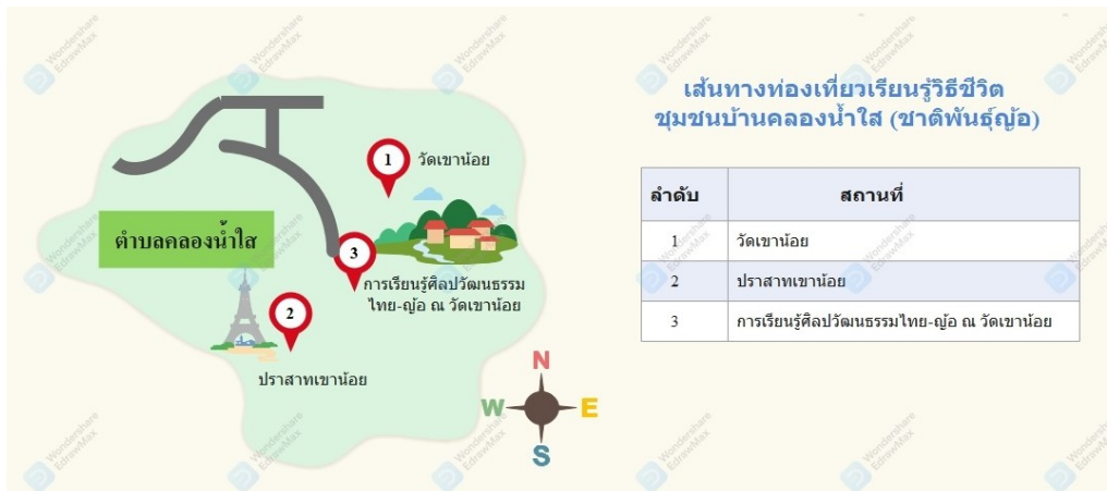
ภาพที่ 2 เส้นทางท่องเที่ยวเชิงพหุวัฒนธรรม ตำบลคลองน้ำใส อำเภอรัญประเทศ จังหวัดสระแก้ว

ผลการพัฒนาเส้นทางท่องเที่ยวเชิงพหุวัฒนธรรม ตำบลคลองน้ำใส อำเภอรัญประเทศ จังหวัดสระแก้ว รายละเอียดดังภาพที่ 2