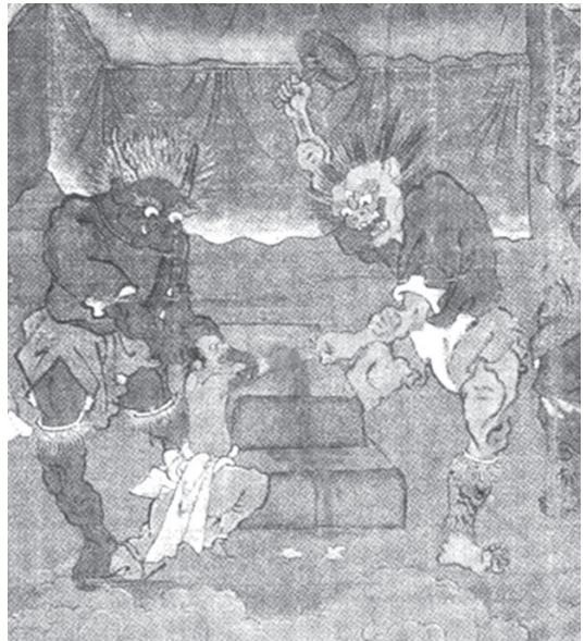
ภาพที่ 2 ภาพ 十王地獄圖 (Juuou-jigoku-zu) หอศิลป์ 出光美術館 (Idemitsu Bijutsukan) (ศตวรรษที่ 14)

รูปแบบการเขียนราชายมโลกและนรกฉากต่าง ๆ ของแผ่นดินใหญ่ โดยเฉพาะอย่างยิ่งของจิตรกรหนิงปัวอย่าง 陸信忠 (RIKU Shinchuu), 陸仲淵 (RIKU Chuuen) และ 金大受 (KIN Daiju) 21 ปรากฏใน