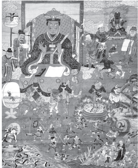
ภาพที่ 1 ภาพ 閻魔府之凶 (Enmafu-no-zu) วัด 東明 (Toumyou) (สมัยปลายศตวรรษที่ 18-ต้นศตวรรษที่ 19)

ภาพนรกในประเทศญี่ปุ่นที่เก่าแก่ที่สุดสืบเนื่องไปถึงสมัยศตวรรษที่ 8 อันเป็นยุคที่ศาสนาพุทธเข้ามาเผยแพร่แล้ว และได้รับความนิยมจากชนชั้นสูงที่มีอิทธิพลทางการเมือง ภาพนรกได้รับการสร้างสรรค์สืบเนื่องต่อมาโดยมักใช้เป็นสื่อเผยแพร่แนวคิดพระพุทธศาสนานิกายต่าง ๆ โดยเริ่มพบมากขึ้นหลังศตวรรษที่ 10 สันนิษฐานว่าเป็นเพราะสภาพการเมืองสมัยนั้นที่ขาดความมั่นคง ทั้งยังมีภัยพิบัติทางธรรมชาติและโรคระบาดมาก ทำให้ผู้คนสมัยนั้นมีประสบการณ์พบเห็นความตายที่เกี่ยวข้องกับตนและผู้อื่นอย่างใกล้ชิด สภาพสังคมเช่นนี้จึงน่าจะมีส่วนให้ความเชื่อและภาพลักษณ์เกี่ยวกับ “末法 (Mappou, ยุคธรรมปลาย)” 2 , “浄土 (Joudo, แดนสุขาวดี)” และ “地獄 (Jigoku, นรก)” แพร่หลายยิ่งขึ้น ประกอบกับนิกายต่าง ๆ ได้รับเอาแนวคิดเรื่องแดนสุขาวดีจากพระพุทธศาสนาจีนมาผนวกกับความเชื่อนิกายตน โดยเฉพาะนิกาย 天台 (Tendai, นิกาย