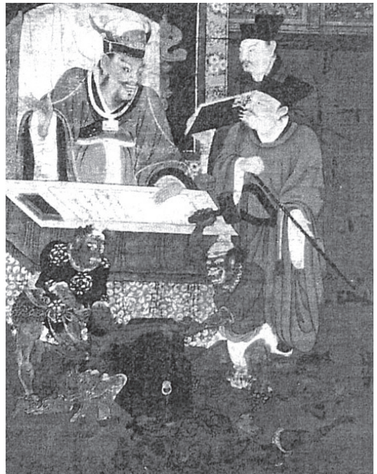
ภาพที่ 3 ภาพ 十王图 (Juuou-zu) Agency for Cultural Affairs (สมัยซ่งใต้)