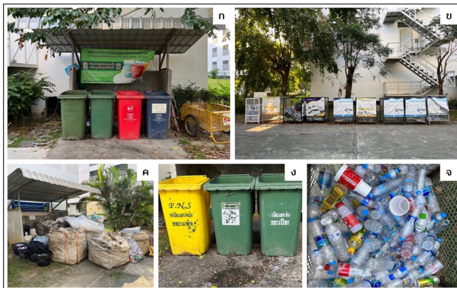
ภาพ 5 (ก) การจัดวางถังในจุดรับขยะทั่วไป (ข) ขยะรีไซเคิล (ค) ขยะรีไซเคิล ที่คัดแยกโดยนิสิตจิตอาสา (ง) น้ำขยะและฝาถังเปิดค้างไว้ (จ) ขยะรีไซเคิลปะปนกัน