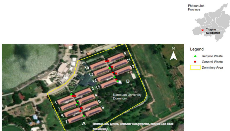
ภาพ 4 จุดทิ้งขยะในหอพักนิสิตมหาวิทยาลัยนเรศวรจำแนกเป็นโซน A และโซน B

1.1 จุดรับขยะทั่วไป มีถังขยะขนาด 240 ลิตร วางคละสีต่างกันไปในแต่ละจุด เช่น บริเวณอาคาร 1 มีถังขยะสีเขียวและเหลือง บริเวณอาคาร 11 มีถังขยะสีน้ำเงิน เขียว และแดง ขึ้นกับสภาพถังที่ใช้งานได้ หรือการนำมาวางสับเปลี่ยนของแม่บ้าน สภาพถังขยะส่วนใหญ่สามารถใช้งานได้ และจัดวางอย่างเป็นระเบียบ (ภาพ 5ก) ไม่พบปัญหาขยะล้นถัง กลิ่นเหม็น แผลงรำคาญ และสุนัขคุ้ยเขี่ย อย่างไรก็ตาม การจัดวางถังขยะสีต่าง ๆ ไม่ได้มีเป้าหมายเพื่อการคัดแยก เนื่องจากขยะทั่วไปมีจำนวนมาก แม่บ้านจึงนำถังขยะสีอื่นมารองรับ ส่วนการทิ้งขยะนิสิตถูกขอความร่วมมือให้ทิ้งในเวลา 06:00-09:00 น. ของทุกวัน โดยนิสิตจะรวบรวมขยะไว้ในถุงดำ หรือถุงพลาสติก แล้วนำมาทิ้งในถังขยะสีใดก็ได้ที่ว่างอยู่ ขยะหลากหลายประเภทจึงปะปนกัน ดังนั้น แม่บ้านประจำหอพักจะเป็นฟันเฟืองแรกของการแยกขยะรีไซเคิลออกจากจุดรับขยะทั่วไป ซึ่งส่วนใหญ่เป็นขยะรีไซเคิลประเภท PET พลาสติกรวม กระดาษลูกฟูก (กระดาษแข็งหรือกระดาษลัง) และกระดาษย่อย (สมุด หนังสือ ตำรา สำเนาเอกสารประกอบการเรียน) กระป๋องอลูมิเนียม ขวดแก้ว รวบรวมแยกไว้ตามประเภท รอการรับซื้อจากธุรกิจรับซื้อของเก่า ส่วนขยะทั่วไปที่เหลืออยู่ พนักงานกองอาคารสถานที่ จะขนถ่ายไปทิ้งยังบ่อฝังกลบขยะภายนอกมหาวิทยาลัย