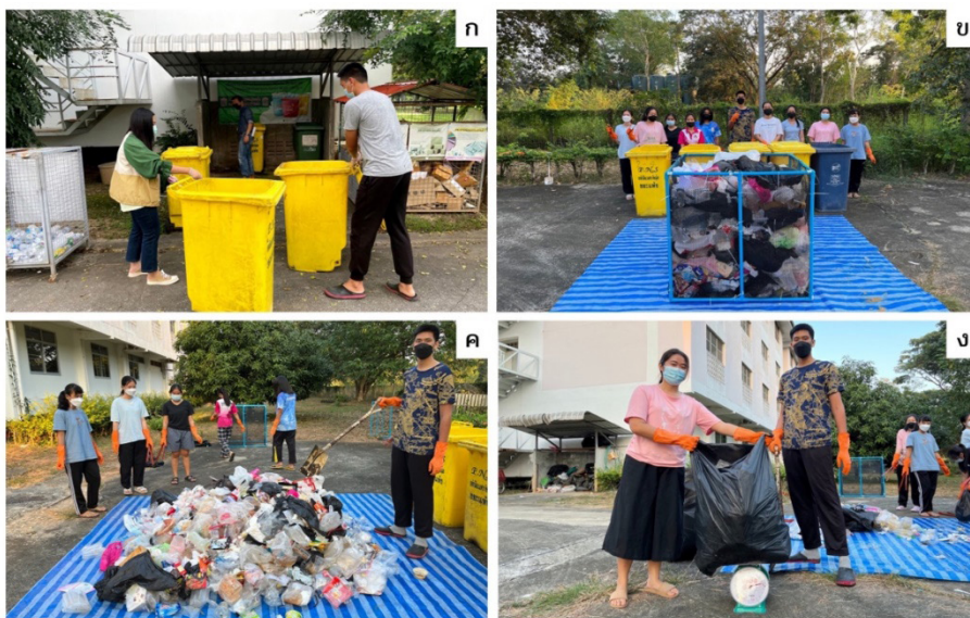
ภาพ 2 (ก) การทดลองสำรวจขยะเบื้องต้น (ข) การสำรวจขยะโดยใช้ตะแกรง ขนาด 1 ลูกบาศก์เมตร (ค) การคัดลูกเคาะขยะ (ง) การชั่งน้ำหนักขยะแต่ละประเภท

ที่มา: ผู้วิจัย, 8 ตุลาคม 2564-18 ธันวาคม 2564