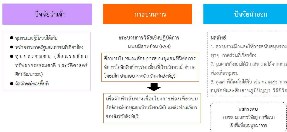
ภาพที่ 1 กรอบแนวคิดการวิจัย