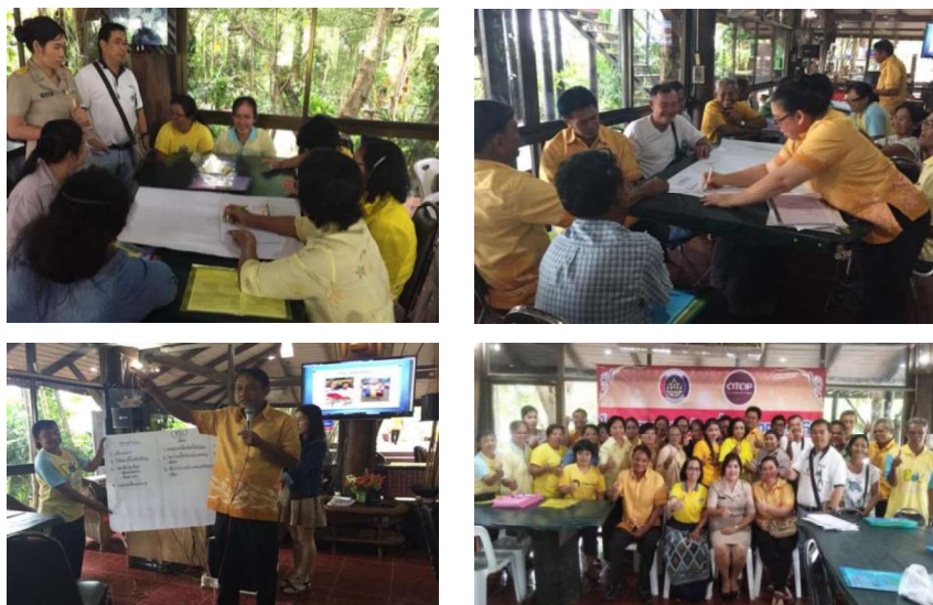
ภาพที่ 2 การสัมภาษณ์เชิงลึกและการจัดสนทนากลุ่มผู้นำชุมชน ตัวแทนชาวบ้าน หน่วยงานภาครัฐและเอกชนที่เกี่ยวข้อง