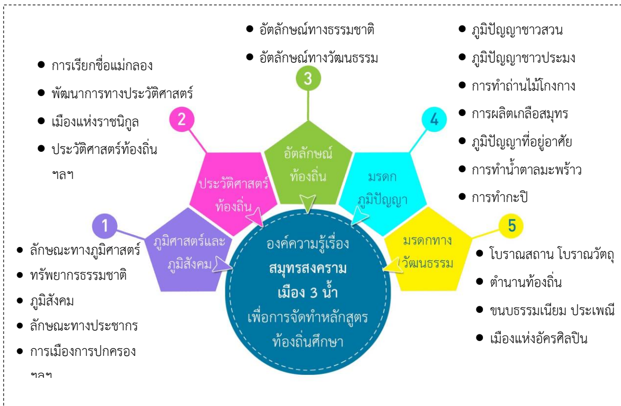
แผนภาพแสดงองค์ความรู้สำคัญและเหมาะสำหรับการจัดทำหลักสูตรท้องถิ่นศึกษา

องค์ความรู้สำคัญที่ควรนำมาใช้เป็นฐานข้อมูลในการจัดทำหลักสูตรท้องถิ่นสำหรับเยาวชนในพื้นที่จังหวัดสมุทรสงคราม แบ่งออกเป็น 5 ประเด็น คือ 1.ภูมิศาสตร์และภูมิสังคม 2.ประวัติศาสตร์ท้องถิ่น 3.อัตลักษณ์ท้องถิ่น 4.มรดกภูมิปัญญา และ 5.มรดกทางวัฒนธรรม ซึ่งผลการวิจัยสรุปได้ดังแผนภาพได้ดังนี้