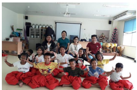
ภาพ 2 การจัดกิจกรรม ร้อง เล่น เต้น รำ สำหรับเด็กและเยาวชนในชุมชนศาลเจ้าพ่อสมบุญ 54