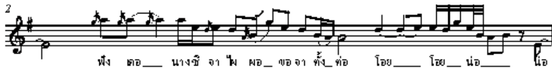
ตัวอย่างที่ 4 โน้ตลำโสม ทำนองบทนำ