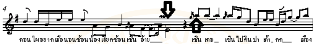
ตัวอย่างที่ 2 โน้ตแสดงช่วงเสียงทำนองลำโสม

ช่วงเสียงจากบทเพลงนี้ โน้ตที่ระดับเสียงสูงสุดในบทเพลงนี้ คือ “มี” ส่วนโน้ตที่ระดับเสียงต่ำสุด คือ “ที” ชั้นคู่ (Interval) เท่ากับคู่ 12 เมื่อพิจารณาแล้ว ในบทเพลงนี้มีช่วงเสียงที่ค่อนข้างกว้างที่เดียวสำหรับเพลงขับร้อง