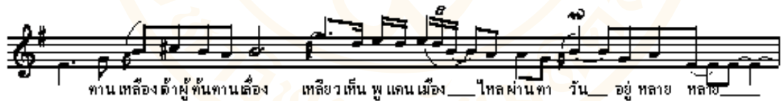
ตัวอย่างที่ 3 โน้ตลำโสม ทำนองบทต้น