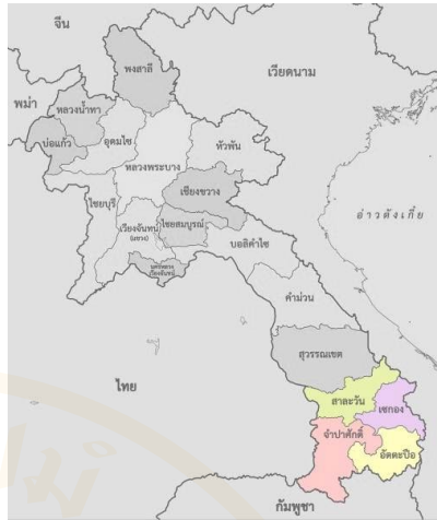
ภาพที่ 2 แผนที่แสดง 4 แขวงภาคใต้ สาธารณรัฐประชาธิปไตยประชาชนลาว

ส่วนหนึ่งของการแสดงคั่นการลำชนิดอื่น ๆ เช่น การแสดงลำสี่พันดอน ในคืนหนึ่งอาจมีการลำโสมคั่นบางช่วงเพื่อเป็นการเปลี่ยนบรรยากาศการแสดง เป็นการแสดงภูมิปัญญาความสามารถของหมอลำ หรือเป็นการลำตามการร้องขอของผู้ชม