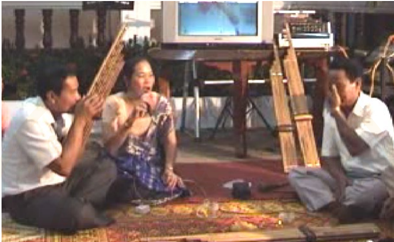
ภาพที่ 4 การแสดงหมอลำสี่พันดอน

หมอลำสี่พันดอนปัจจุบันสามารถแบ่งได้เป็นสองกลุ่ม คือ กลุ่มปากเซและกลุ่มเมืองโขง ซึ่งอยู่ในแขวงเดียวกัน คือ แขวงจำปาศักดิ์ หมอลำกลุ่มปากเซเป็นหมอลำที่มีความร่วมสมัยกันในด้านอายุของหมอลำ ส่วนหมอลำกลุ่มเมืองโขงส่วนมากจะเป็นหมอลำผู้ใหญ่ที่มีอายุมากแล้วกอปรกับการแสดงจะเป็นแบบเรียบง่ายไม่ทันสมัย