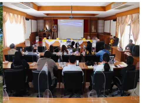
ภาพที่ 6 โครงการวิจัยที่ 5 เรื่อง การประเมินและพัฒนาระดับ คุณภาพชีวิตฯ ที่มา: (Thawa & Tunyarat, 2022)