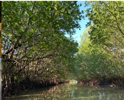
ภาพที่ 2 โครงการวิจัยที่ 1 เรื่องอุโมงค์โกงกาง ที่มา: (Rammasut & Werapong, 2022)