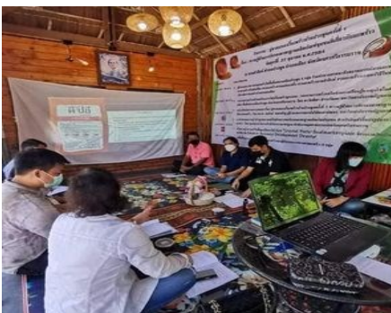
ภาพที่ 4 โครงการวิจัยที่ 3 เรื่อง พริ้วผูกเกลอก