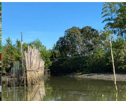
ภาพที่ 5 โครงการวิจัยที่ 4 เรื่อง ทุนประวัติศาสตร์ปากพูน