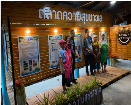
ภาพที่ 1 ตลาดความสุขชาวเล

โดยสรุป การสร้างพื้นที่การเรียนรู้เพื่อสร้างเศรษฐกิจท้องถิ่นและคุณภาพชีวิตในพื้นที่เทศบาลเมืองปากพูน จังหวัดนครศรีธรรมราช ซึ่งตั้งอยู่ภายใต้กลุ่ม “ตลาดความสุขชาวเล” เกิดขึ้นภายใต้ข้อตกลงร่วมของชุมชนในการแลกเปลี่ยนความรู้ของกลุ่มภาคประชาชน ตัวแทนผู้ประกอบการ ภาครัฐ และภาคเอกชน และตกผลึกจนกลายเป็นพื้นที่แห่งภูมิปัญญา เศรษฐกิจ และสังคมของการพัฒนาเชิงพื้นที่เทศบาลเมืองปากพูน ดังภาพที่ 1-6