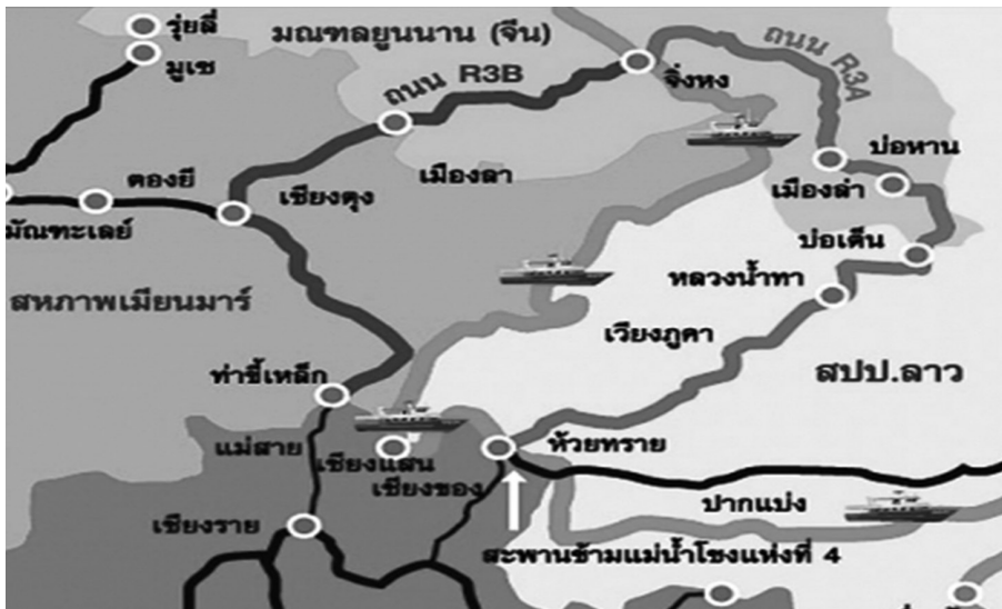
ภาพที่ ๑ แผนที่การเก็บข้อมูลการวิจัย

ขอบเขตด้านพื้นที่: คณะนักวิจัยฯ ได้เดินทางรวบรวมข้อมูลวิจัยพื้นที่ตามเส้นทาง R3A เชื่อมต่อระหว่าง อ.เชียงของ-อ.เชียงแสน จ.เชียงราย ไปยังเมืองห้วยทราย แขวงบ่อแก้ว-เมืองสิงห์-เมืองบ่อเต็น แขวงหลวงน้ำทา สปป.ลาว และต่อไปยังเมืองบ่อหาน เขตสิบสองปันนามณฑลยูนนาน ประเทศจีน และเส้นทาง R3B เชื่อมต่อระหว่าง อ.แม่สาย จ.เชียงราย-จังหวัดท่าขี้เหล็ก-เมืองเชียงตุง รัฐฉาน ประเทศเมียนมา ดังภาพที่ ๑