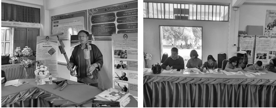
ภาพที่ 2 การดำเนินการสืบทอดวัฒนธรรมตามแผนการจัดการเรียนรู้

2.1.1. วิธีการสร้างให้ผู้สืบทอดวัฒนธรรมค้นพบความรู้ด้วยตัวเอง คือ การปล่อยให้เขาได้สัมผัสกับสิ่งที่เขาจะเรียนรู้ คือ การให้แคนหน่อจีไหละ คนละ 1 ชิ้น เพื่อให้เขาได้ศึกษา และจดจำส่วนประกอบของแคน ไปพร้อมๆกับการให้ความรู้ และสื่อประกอบการเรียนรู้ ที่มีในแหล่งเรียนรู้ นั้น ๆ สิ่งที่เป็นต่อการค้นพบความรู้ คือ ความพร้อมของอุปกรณ์ที่ส่งเสริมการเรียนรู้ “แคนหน่อจีไหละ” โดยให้กระดาะคำถามที่มีภาพและให้เขาออกข้อขึ้นส่วนประกอบให้ถูกต้อง จากการศึกษาเอง