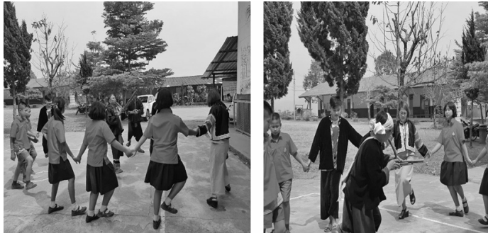
ภาพที่ 3 กิจกรรมการเคลื่อนไหวทางกาย การเต้นจำตี ประกอบเสียงแคนน้ำเต้า

2.2.3 วิธีการสร้างกิจกรรมเคลื่อนไหวทางกายอย่างเหมาะสมกับวัยและความสนใจ ผู้ถ่ายทอด ผู้วิจัยและปราชญ์แคนทำเป็นแบบอย่างและให้ผู้รับการสืบทอด ปฏิบัติไปพร้อม ๆ กับการเป่าแคน ทำซ้ำ ๆ จนเขาสามารถจดจำท่วงท่า และทำนองของเพลงจากแคนหน่อจี่แหละได้ สิ่งสำคัญของกิจกรรมเคลื่อนไหวร่างกาย คือ จังหวะ เสียงแคน และการบรรเลง ที่สร้างความสนุกสนาน สำหรับเด็กและเยาวชนนั้น ใช้จังหวะที่เร้าใจ เพื่อกระตุ้นให้เกิดการเคลื่อนไหวร่างกาย