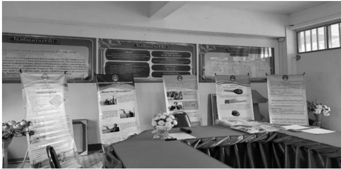
ภาพที่ 1 การเตรียมแหล่งเรียนรู้และสื่อการเรียนรู้

1.1.3. การจัดทำแผนการจัดการเรียนรู้ ได้เสนอความคิดเห็นให้เตรียมกิจกรรมที่จะถ่ายทอดองค์ความรู้โดยมีลำดับดังนี้