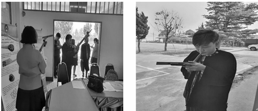
ภาพที่ 3 ลักษณะการเรียนรู้เพื่อค้นหาความรู้ด้วยตนเอง

2.1.1. วิธีการสร้างให้ผู้สืบทอดวัฒนธรรมค้นพบความรู้ด้วยตัวเอง คือ การปล่อยให้เขาได้สัมผัสกับสิ่งที่เขาจะเรียนรู้ คือ การให้แคนหน่อจีไหละ คนละ 1 ชิ้น เพื่อให้เขาได้ศึกษา และจดจำส่วนประกอบของแคน ไปพร้อมๆกับการให้ความรู้ และสื่อประกอบการเรียนรู้ ที่มีในแหล่งเรียนรู้ นั้น ๆ สิ่งที่เป็นต่อการค้นพบความรู้ คือ ความพร้อมของอุปกรณ์ที่ส่งเสริมการเรียนรู้ “แคนหน่อจีไหละ” โดยให้กระดาะคำถามที่มีภาพและให้เขาออกข้อขึ้นส่วนประกอบให้ถูกต้อง จากการศึกษาเอง