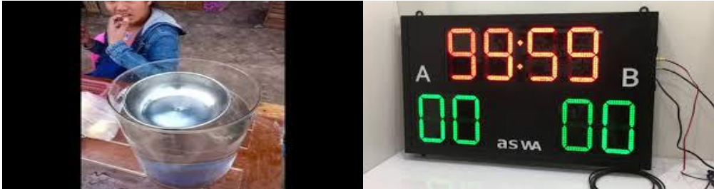
ภาพที่ 1 เครื่องมือจับเวลาการประกวดแข่งขันนก

เวลาแข่งขันโดยใช้นาฬิกาดิจิตอลจึงเป็นทางออกที่ทำให้การจับเวลามีความเที่ยงตรงยุติธรรม และมีความเป็นสากล เรื่องทำนองนี้แวดวงการประกวดแข่งขันนกพิราบแม้รายละเอียดการแข่งขันจะต่างกันแต่ได้ยอมรับนวัตกรรม