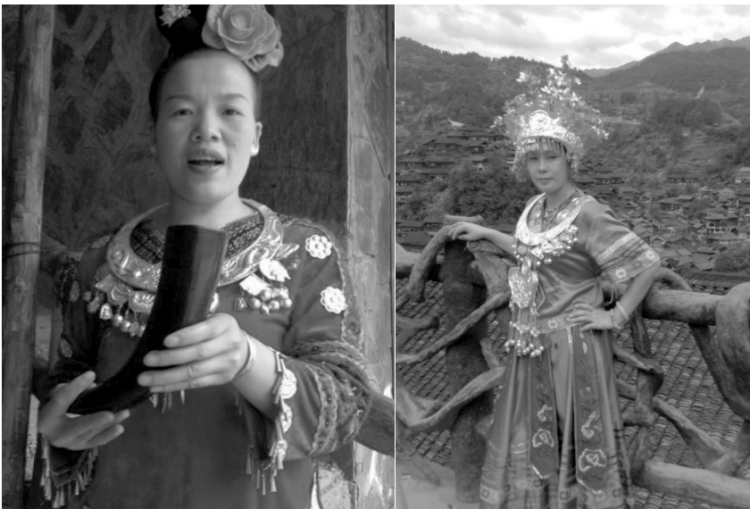
ภาพประกอบที่ 3-4 贵州苗族服装 การแต่งกายของหญิงสาวม้งในกุ้ยโจว

从中国贵州黔东南西江苗寨到泰国清迈的昆岗拉和麦沙买苗寨，虽相隔万里之遥，可苗族人民选择的居住环境却惊人的相似，均“寻闭塞之处而隐，觅险峻之地而居”，这是为何？纵观苗族历史上五次大迁徙可知，他们跨越几千年的“逐水而徙”都是迫于战乱，都是在面对异族的排挤追杀不得已辗转迁徙，由于是逃亡的难民，显然不可能占据那些已被“先入为主”的族民所占据的肥沃富饶之地，加之为了躲避仇家的追杀，最好的办法只好隐遁于无人问津的深山丛林，在深山里缓坡地带开垦耕地，种植各种农作物以维持生计，虽土地贫瘠，交通闭塞，但既可避开异族的杀身之祸保全性命，又能回避与当地居民因土地争夺产生新的矛盾冲突，于是，苗族先民便选择了这样一种在深山里隐遁的生存方式，无论他们迁徙的路途有多遥远，这种生存法却始终一脉相承。