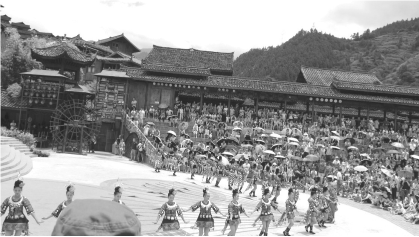
ภาพประกอบที่ 5 贵州省西江苗族节日歌舞表演 การแสดงร้องรำฟ้อนบ้านของชาวม้งที่อำเภอขงจิน มณฑลกุ้ยโจว