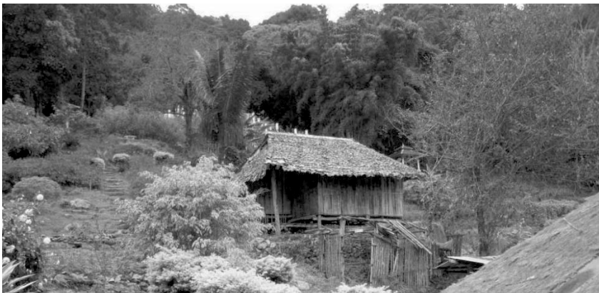
ภาพประกอบที่ 2 泰国清迈府苗寨 บ้านของชาว ม้ง ในจังหวัด เชียงใหม่ ในประเทศไทย

苗族，是一支有着悠久历史的民族，其发端可追溯到距今约四五千年前的炎黄传说时代，他们最早的居住地据考证是在黄河流域，因为部族战争迁徙到长江流域，后再经过数次迁徙，迄今足迹亦遍布于中国、老挝、泰国、越南、美国、法国、澳大利亚等世界各地。在中国，共有苗族人民500多万，而贵州黔东南是苗族人民聚居最多的地方，其人口数量达3,688,900人，占全国苗族总人口的51.3%。可以说，贵州的苗族具有世界苗族的代表性特征，贵州黔东南雷山县的“西江千户苗寨”是世界上最大的苗寨，又成为贵州苗族的典型代表。而在泰国，苗族主要分布在泰北的清迈、清莱等府，又尤以清迈府的昆岗拉苗寨、麦沙买苗寨最具代表性。笔者利用在泰国支教一年的时间，有机会对生活在泰国的苗族进行深入的考察，经比较研究，发现虽相隔千山万水，历经斗转星移，可两地的苗族人民在生活环境、风俗习惯、宗教信仰、审美形态等方面有着很多的相似性，充分体现了他们一脉相承的同宗同源关系。