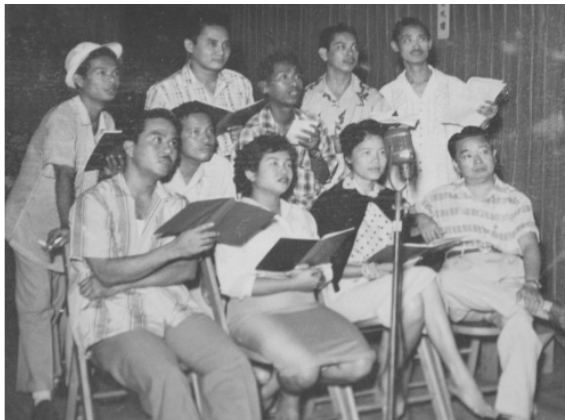
ภาพประกอบที่ 1 นักร้องเพลงหน้าม่าน สลับการแสดงละครของคณะผกาวิไล ปี พ.ศ.2488

ที่มาของคำว่า “เพลงลูกทุ่ง” พัฒนาการระยะแรกของเพลงลูกทุ่งนั้น ใช้คำว่า “เพลงตลาด หรือ เพลงชีวิต” เป็นคำเรียกบทเพลงของนักร้องเพลงไทยสากลกลุ่มหนึ่งในช่วงภายหลังสงครามครั้งที่ 2 อย่างไม่เป็นทางการ โดย ป. วรานนท์ (ประชา วรานนท์) นักจัดรายการวิทยุพล 1 ใช้เรียกขาน เมื่อประมาณ ปี พ.ศ. 2498 – 2499 เพลงแนวนี้ได้รับความนิยมกว้างขวาง เหล่านักร้องที่ถูกเรียกขานว่า เป็นกลุ่มนักร้องเพลงตลาด บางคนก็ถูกเรียกขานว่าเป็นนักร้องเพลงชีวิต เพราะร้องเพลงสะท้อนชีวิต สะท้อนสังคม เช่น แสงนภา บุณราศรี, คำรณ สัมบุณณานนท์, เสน่ห์ โกมารชุน (จำนง รังสิกุล, 2527 : 72) ซึ่งทั้งสี่ลาและการขับร้องเป็นลักษณะที่แตกต่างจากเพลงหรือลีลาการขับร้องเพลงของนักร้องที่มีผลงานเพลงแพร่หลายอยู่ในขณะเดียวกัน