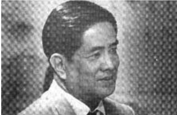
ภาพประกอบที่ 2 จ้าง รังสิกุล