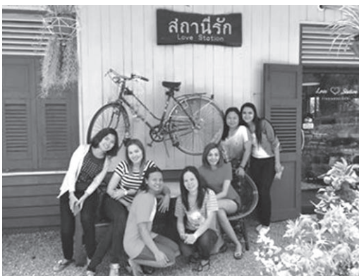
ภาพที่ 4 ร้านสถานีรักในปัจจุบัน