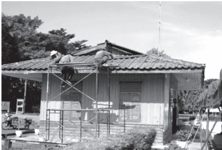
ภาพที่ 3 ร้านสถานีรักก่อนได้รับการปรับปรุง

มัสตาร์ตสลับน้ำตาลเช่นเดียวกับสถานีรถไฟกันตังจนเกิดเป็นร้านสถานีรักในปัจจุบัน (ภาพที่ 4) บริเวณภายนอกของร้านสถานีรักนั้น เจ้าของร้านมีการจัดฉากไว้เยอะแยะมากมาย เพราะสร้างจุดสนใจให้แก่นักท่องเที่ยวเข้ามาถ่ายภาพเป็นที่ระลึก อีกทั้งชื่อของร้านสถานีรักนั้น มีผู้คนมากมายต่างพากันให้ความหมายให้กับร้านแห่งนี้ โดยมีความหมายเชื่อมโยงกับสถานีรถไฟกันตัง โดยเฉพาะคู่รัก บ้างก็ว่าการเดินทางด้วยเส้นทางรถไฟ เปรียบตั้งเป็นเส้นทางแห่งการดำเนินชีวิตที่คู่รักต้องพบกันและจากกันที่นี่ บ้างก็ว่าสถานีรถไฟกันตังเป็นสุดเส้นทางรถไฟ ฟังอันดามันเปรียบตั้งเป็นสุดทางรักของคู่รัก ด้วยความหมายดีๆ ที่ทุกคนต่างมอบให้กับสถานีรถไฟคลาสสิกแห่งนี้ ทำให้สถานีรถไฟกันตังและร้านสถานีรักมีวัตถุประสงค์ที่สอดคล้องกัน ในการตอบโจทย์นักท่องเที่ยวที่ต้องการท่องเที่ยวแบบไฮโซไฮดี และยังสอดคล้องกับคุณค่าและความหมาย ทำให้สถานีรถไฟกันตังกลายเป็นอีกหนึ่งสถานที่ท่องเที่ยวที่ทุกคนใช้เป็นพื้นที่ในการถ่ายภาพ พรีเวดดิ้ง (ภาพที่ 5) เพื่อเก็บภาพแห่งความประทับใจ ถือเป็นการสรรสร้าง ความทรงจำดีๆ ให้เกิดขึ้นกับผู้คน