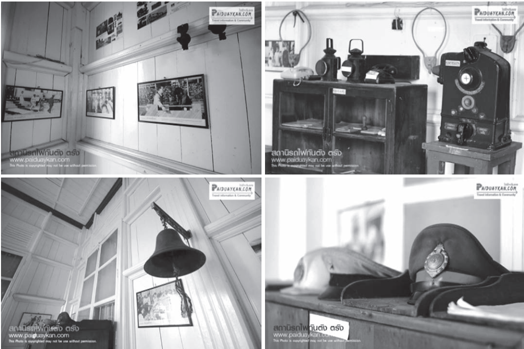
ภาพที่ 2 ห้องพิพิธภัณฑ์ : ร่องรอยรถไฟในอดีต

2. ห้องพิพิธภัณฑ์ : ร่องรอยรถไฟในอดีต (ภาพที่ 2) ถูกนำมาประกอบสร้างเพื่อให้เห็นคุณค่าของรถไฟ และที่มาของรถไฟกันดั้งในอดีต นำมาอนุรักษ์ไว้เพื่อถวิลถึงอดีต และให้ความหมายใหม่ถึงความสำคัญของการเป็นแหล่งท่องเที่ยวเรียนรู้ประวัติศาสตร์ของการรถไฟที่เจริญรุ่งเรืองในอดีต และจังหวัดตรังยังเป็นสถานที่รับเสด็จในรัชสมัยตั้งแต่พระบาทสมเด็จพระจุลจอมเกล้าเจ้าอยู่หัว (รัชกาลที่ 5) พระบาทสมเด็จพระมงกุฎเกล้าเจ้าอยู่หัว (รัชกาลที่ 6) พระบาทสมเด็จพระปกเกล้าเจ้าอยู่หัว (รัชกาลที่ 7) พระบาทสมเด็จพระเจ้าอยู่หัวภูมิพลอดุลยเดช (รัชกาลที่ 9) สมเด็จพระนางเจ้าสิริกิติ์ พระบรมราชินีนาถ สมเด็จพระบรมโอรสาธิราชฯ สยามมกุฎราชกุมาร และสมเด็จพระเทพรัตนราชสุดาฯ สยามบรมราชกุมารี