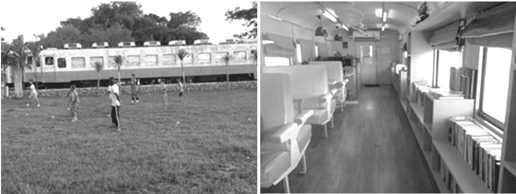
ภาพที่ 6 ห้องสมุดในโบกี้รถไฟบริเวณพื้นที่ย่านสถานีรถไฟกันตัง

4. ห้องสมุดรถไฟ : แหล่งเรียนรู้ ห้องสมุดในโบกี้รถไฟบริเวณพื้นที่ย่านสถานีรถไฟกันตัง (ภาพที่ 6) เป็นแหล่งเรียนรู้อีกหนึ่งแห่งที่ดำเนินการโดยเทศบาลเมืองกันตังร่วมกับการรถไฟแห่งประเทศไทย ได้เข้ามามีบทบาทในการอนุรักษ์ ดูแล และซ่อมแซมปรับปรุงโบราณสถานอาคารสถานีรถไฟกันตัง จึงส่งผลให้มีนโยบายจัดตั้งโครงการปรับปรุงภูมิทัศน์ ที่ดินย่านสถานีรถไฟกันตัง เมื่อปี พ.ศ. 2553 ในการพัฒนาพื้นที่บริเวณดังกล่าว จึงทำให้เกิดโครงการห้องสมุดรถไฟที่พัฒนามาจากโบกี้รถไฟเก่าเพื่อพัฒนาสภาพแวดล้อมให้มีคุณค่าและเป็นประโยชน์แก่ชาวเมืองกันตังสืบต่อไป ซึ่งทำให้มีภูมิทัศน์ที่สวยงามเหมาะแก่การเป็นสถานที่ท่องเที่ยวเชิงวัฒนธรรมซึ่งประกอบไปด้วยวัฒนธรรมที่หลากหลายและมีความเป็นเอกลักษณ์ในตัวเอง ส่งผลให้ชุมชนจากเดิมที่ไม่คึกคักอย่างเช่นในอดีตเปลี่ยนไปสู่ชุมชนที่มีกิจกรรมการท่องเที่ยวเพิ่มเข้ามามากขึ้น อีกทั้งยังเป็นจุดรวมกลุ่มของเยาวชนและชาวบ้านเมืองกันตังอีกด้วย