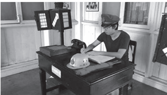
ภาพที่ 9 สมุดบันทึกความทรงจำทางสังคมของผู้คนที่มาเยือน

6. สมุดบันทึกความทรงจำทางสังคมของผู้คนที่มาเยือน (ภาพที่ 9) เป็นสมุดบันทึกความรู้สึกของผู้คนที่มาเยือนสถานีรถไฟกันตัง ซึ่งผู้คนที่เข้ามาเที่ยวชมสถานีรถไฟกันตังจะได้รับความรู้เกี่ยวกับวิวัฒนาการของรถไฟไทยและประวัติความเป็นมาของสถานีรถไฟกันตัง ทั้งยังสะท้อนให้เห็นถึงความเจริญของรถไฟไทยตามยุคสมัย ถือเป็นสถานที่ท่องเที่ยวที่สามารถให้เยาวชนใช้เป็นแหล่งเรียนรู้ และเพื่อให้ผู้มาเยือนได้ระลึกถึงภูมิหลังเรื่องราวทางประวัติศาสตร์ที่มีคุณค่า อีกทั้งนักท่องเที่ยว จะได้รับความสุขจากบรรยากาศอันน่ารื่นรมย์ที่รายล้อมสถานีรถไฟกันตังด้วยของเก่าที่ยังคงสภาพสมบูรณ์หาดูได้ยากในยุคแห่งเทคโนโลยีเช่นนี้ โดยนักท่องเที่ยวจะได้สัมผัสถึงวิถีชีวิตของชาวบ้านไม่ว่าจะเป็นช่วงที่รถไฟเข้าหรือในยามเย็นที่ชาวบ้านใช้เป็นสถานที่พักผ่อนหย่อนใจ จะเห็นได้ว่าสถานีรถไฟกันตังสามารถสร้างความประทับใจ และสร้างความทรงจำให้แก่ผู้คนที่มาเยือน โดยสะท้อนให้เห็นว่าสถานีรถไฟกันตังเป็นสถานที่ท่องเที่ยวที่น่าชื่นชมและควรค่าแก่การอนุรักษ์เป็นอย่างยิ่ง