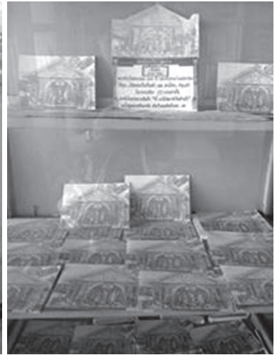
ภาพที่ 8 โปสการ์ด

6. สมุดบันทึกความทรงจำทางสังคมของผู้คนที่มาเยือน (ภาพที่ 9) เป็นสมุดบันทึกความรู้สึกของผู้คนที่มาเยือนสถานีรถไฟกันตัง ซึ่งผู้คนที่เข้ามาเที่ยวชมสถานีรถไฟกันตังจะได้รับความรู้เกี่ยวกับวิวัฒนาการของรถไฟไทยและประวัติความเป็นมาของสถานีรถไฟกันตัง ทั้งยังสะท้อนให้เห็นถึงความเจริญของรถไฟไทยตามยุคสมัย ถือเป็นสถานที่ท่องเที่ยวที่สามารถให้เยาวชนใช้เป็นแหล่งเรียนรู้ และเพื่อให้ผู้มาเยือนได้ระลึกถึงภูมิหลังเรื่องราวทางประวัติศาสตร์ที่มีคุณค่า อีกทั้งนักท่องเที่ยว จะได้รับความสุขจากบรรยากาศอันน่ารื่นรมย์ที่รายล้อมสถานีรถไฟกันตังด้วยของเก่าที่ยังคงสภาพสมบูรณ์หาดูได้ยากในยุคแห่งเทคโนโลยีเช่นนี้ โดยนักท่องเที่ยวจะได้สัมผัสถึงวิถีชีวิตของชาวบ้านไม่ว่าจะเป็นช่วงที่รถไฟเข้าหรือในยามเย็นที่ชาวบ้านใช้เป็นสถานที่พักผ่อนหย่อนใจ จะเห็นได้ว่าสถานีรถไฟกันตังสามารถสร้างความประทับใจ และสร้างความทรงจำให้แก่ผู้คนที่มาเยือน โดยสะท้อนให้เห็นว่าสถานีรถไฟกันตังเป็นสถานที่ท่องเที่ยวที่น่าชื่นชมและควรค่าแก่การอนุรักษ์เป็นอย่างยิ่ง