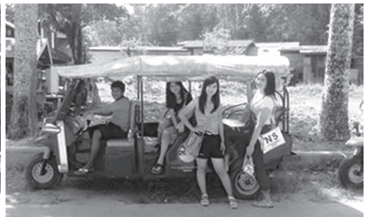
ภาพที่ 10 รถตุ๊กตุ๊กจากโครงการส่งเสริมการท่องเที่ยวเชิงอนุรักษ์ จังหวัดตรัง