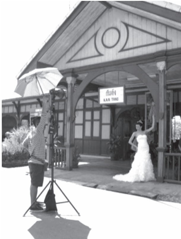
ภาพที่ 1 จุดที่นักท่องเที่ยวเข้ามาถ่ายภาพที่สถานีรถไฟกันตัง