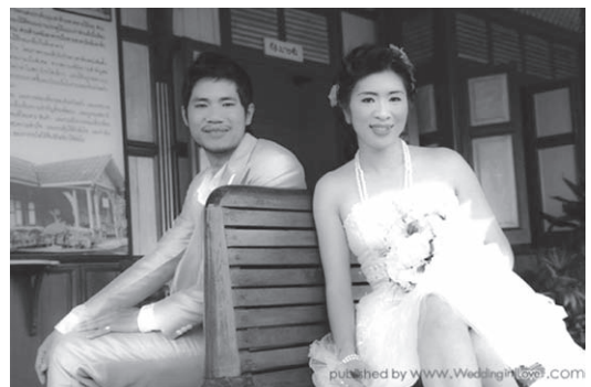
ภาพที่ 5 คู่รักถ่ายภาพพรีเวดดิ้งบริเวณพื้นที่ ย่านสถานีรถไฟกันตัง